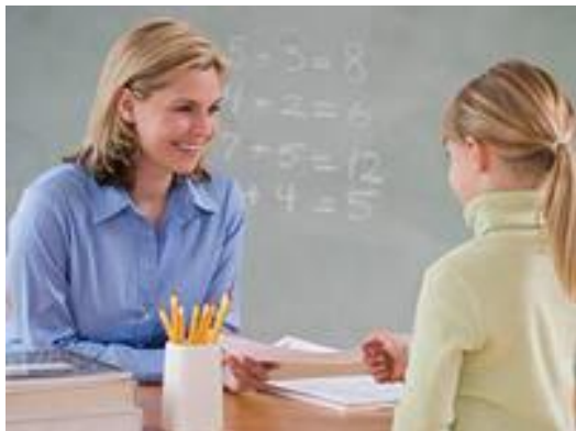
учитель – ученик