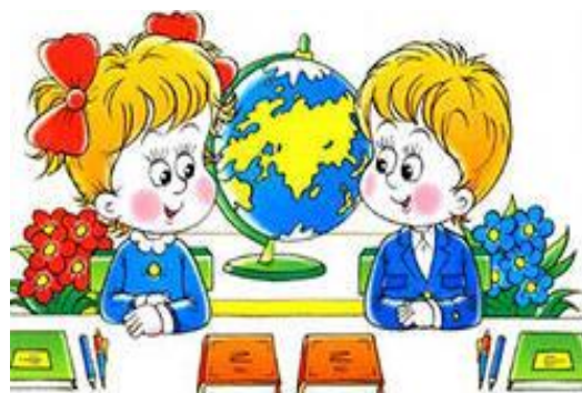
ученик – ученик