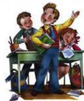
ученик – малая группа