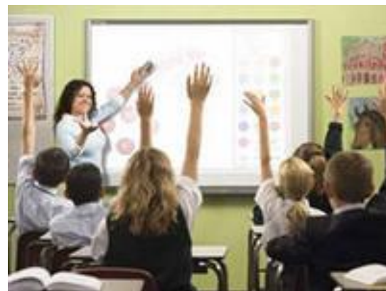
учитель – класс