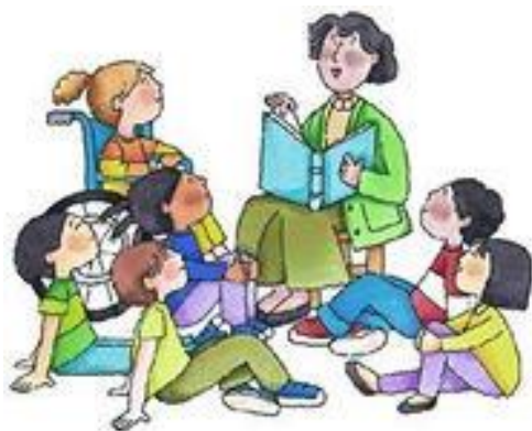
учитель – малая группа