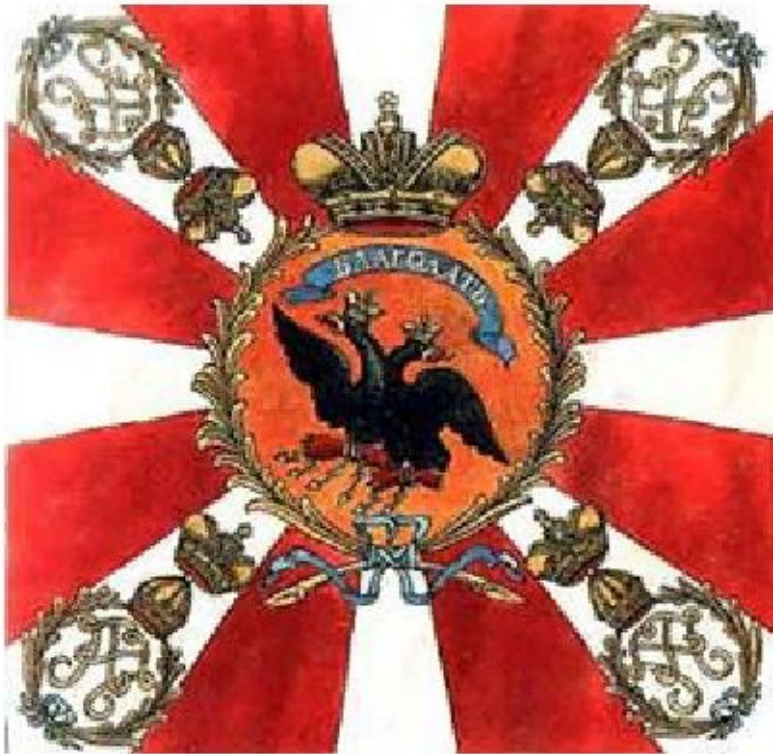
Знамя лейб-гвардии Измайловского полка образца 1799 года

Обозначение «знамя» обычно употребляется, когда говорят о знаках отличия предприятий, организаций, сухопутных и военно-воздушных частей и соединений. Знамя изготавливается в отличие от флага в единственном экземпляре и крепится только непосредственно к древку.