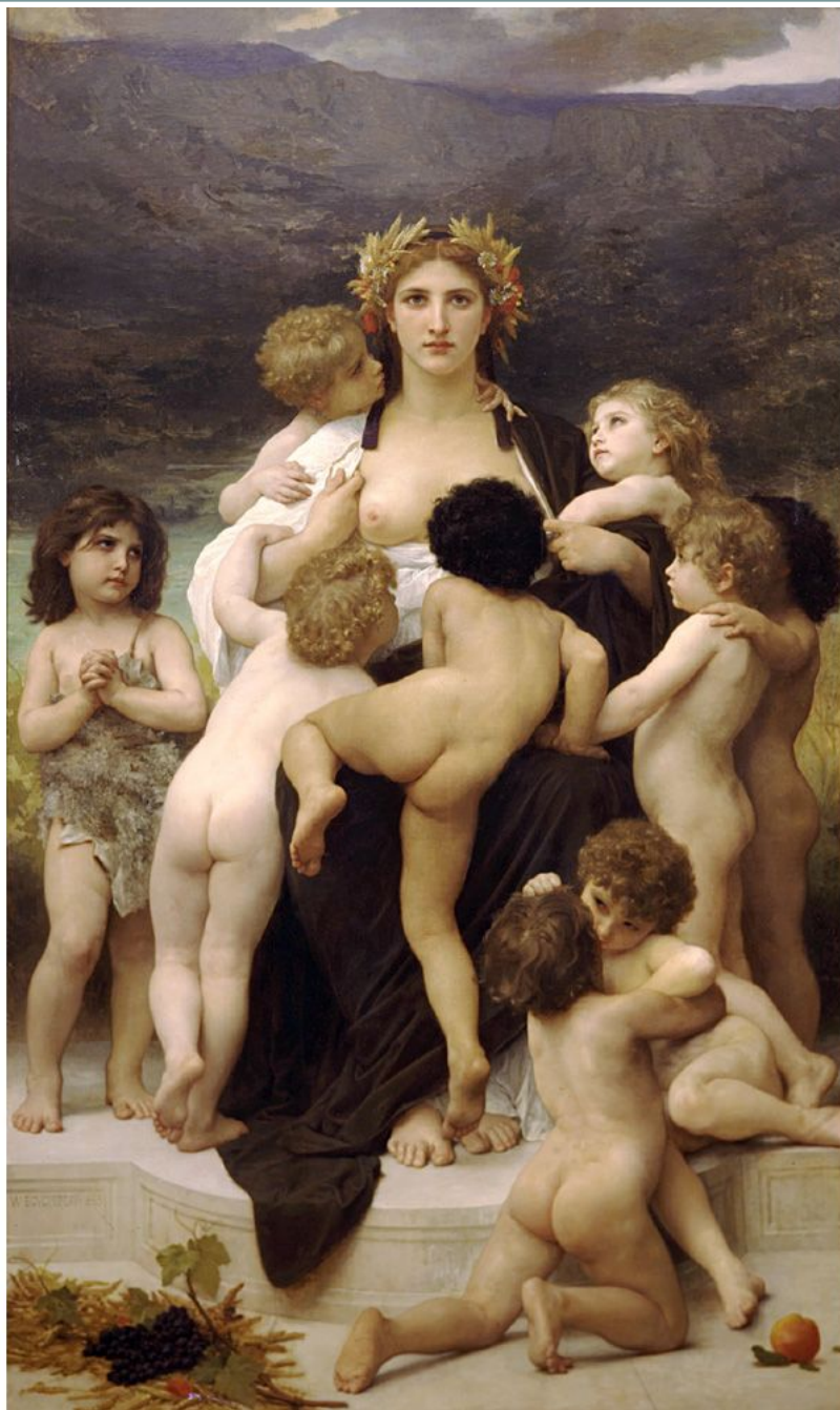
Адольф Вильям Бугро. «Родина-Мать». 1883.