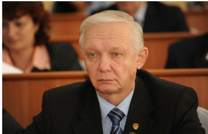
Усатюк Валерий Петрович - член Совета Федерации Федерального собрания, член Бюро комитета Хакасского регионального отделения КПРФ