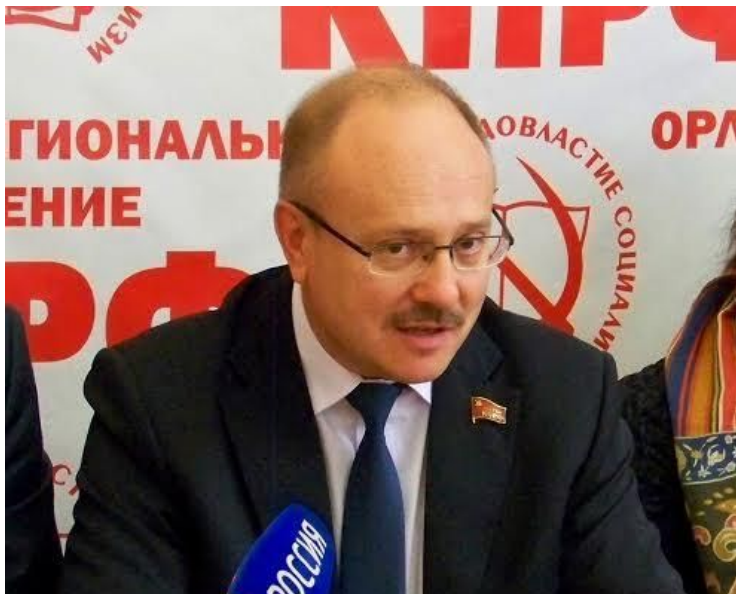
Иконников Василий Николаевич -первый секретарь Орловского обкома КПРФ, член ЦК КПРФ, член бюро областного отделения КПРФ, член Совета Федерации Федерального собрания