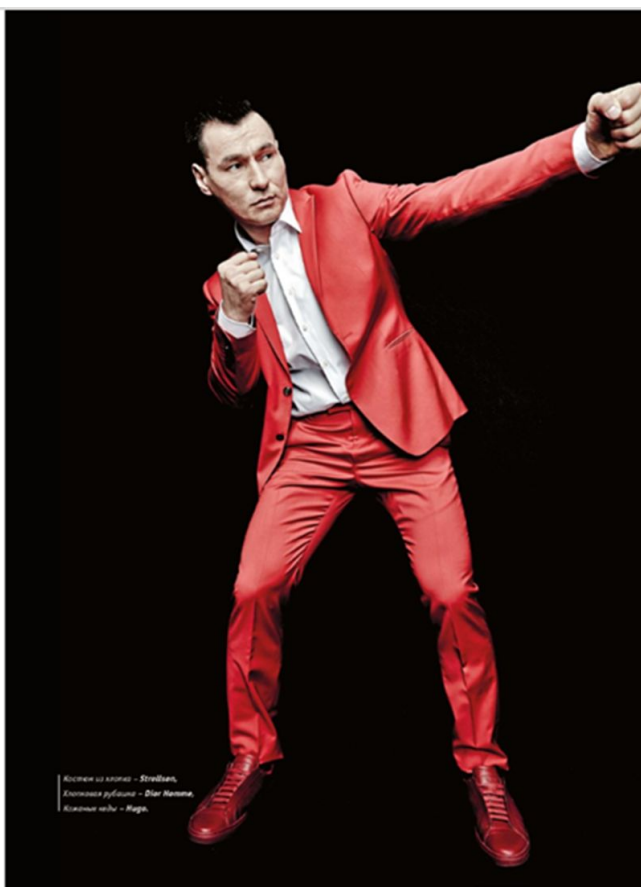
Костюм из мюзикла — Ströblum, плавание рубашка — Dior Homme, классические часы — Hugo.