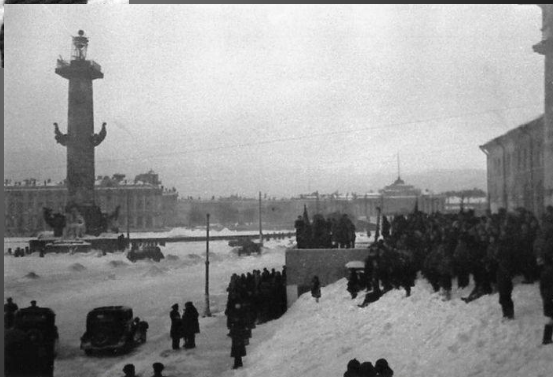
Жители Ленинграда у здания биржи встречают известие о снятии блокады города.