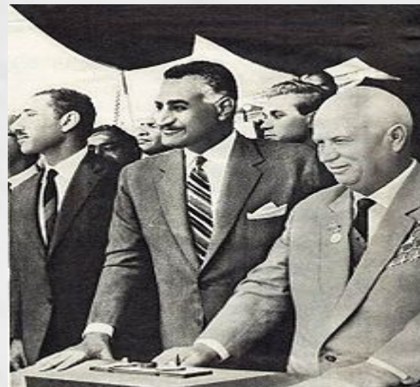
Хрущёв и президент Египта Гамаль Абдель Насер