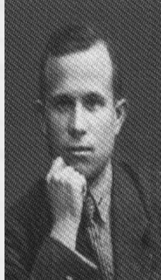
Н. С. Хрущёв в период его обучения в Донтехникуме