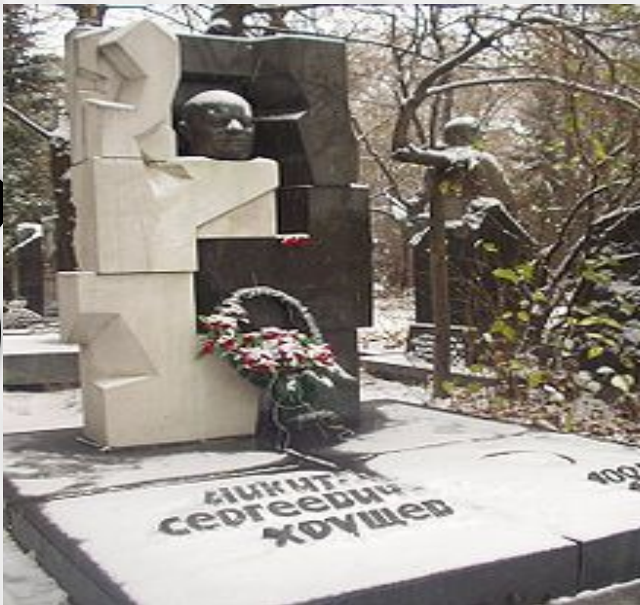
Эрнст Неизвестный. Могила Никиты Сергеевича Хрущёва на Новодевичьем кладбище в Москве