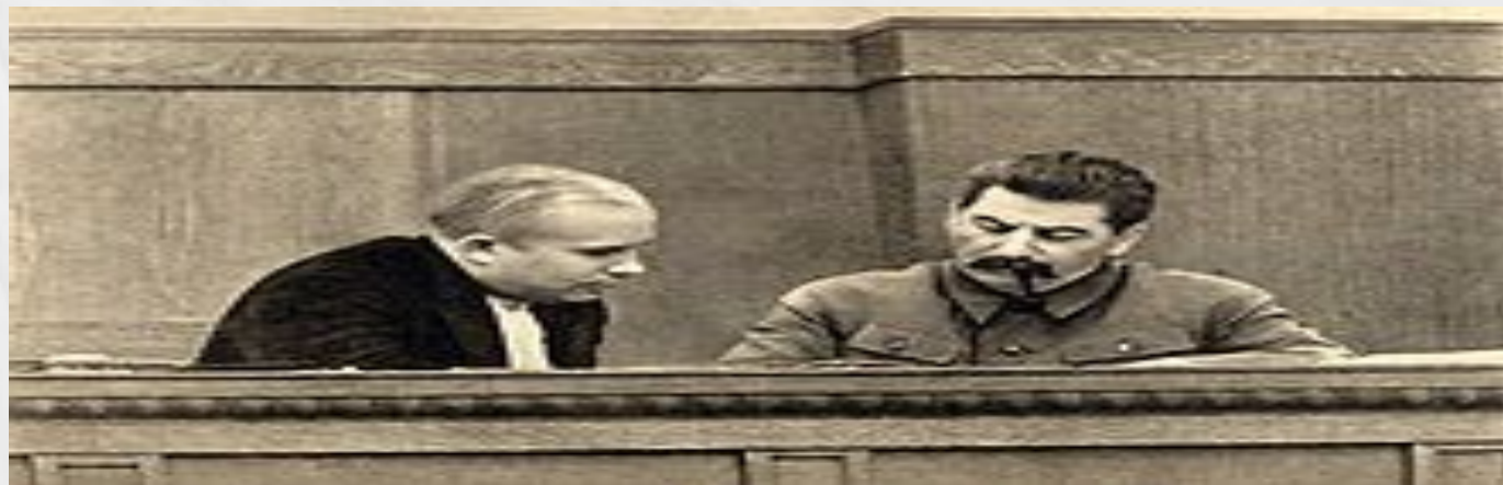
Сталин и Хрущёв в президиуме сессии ЦИК Союза ССР (январь 1936 года)