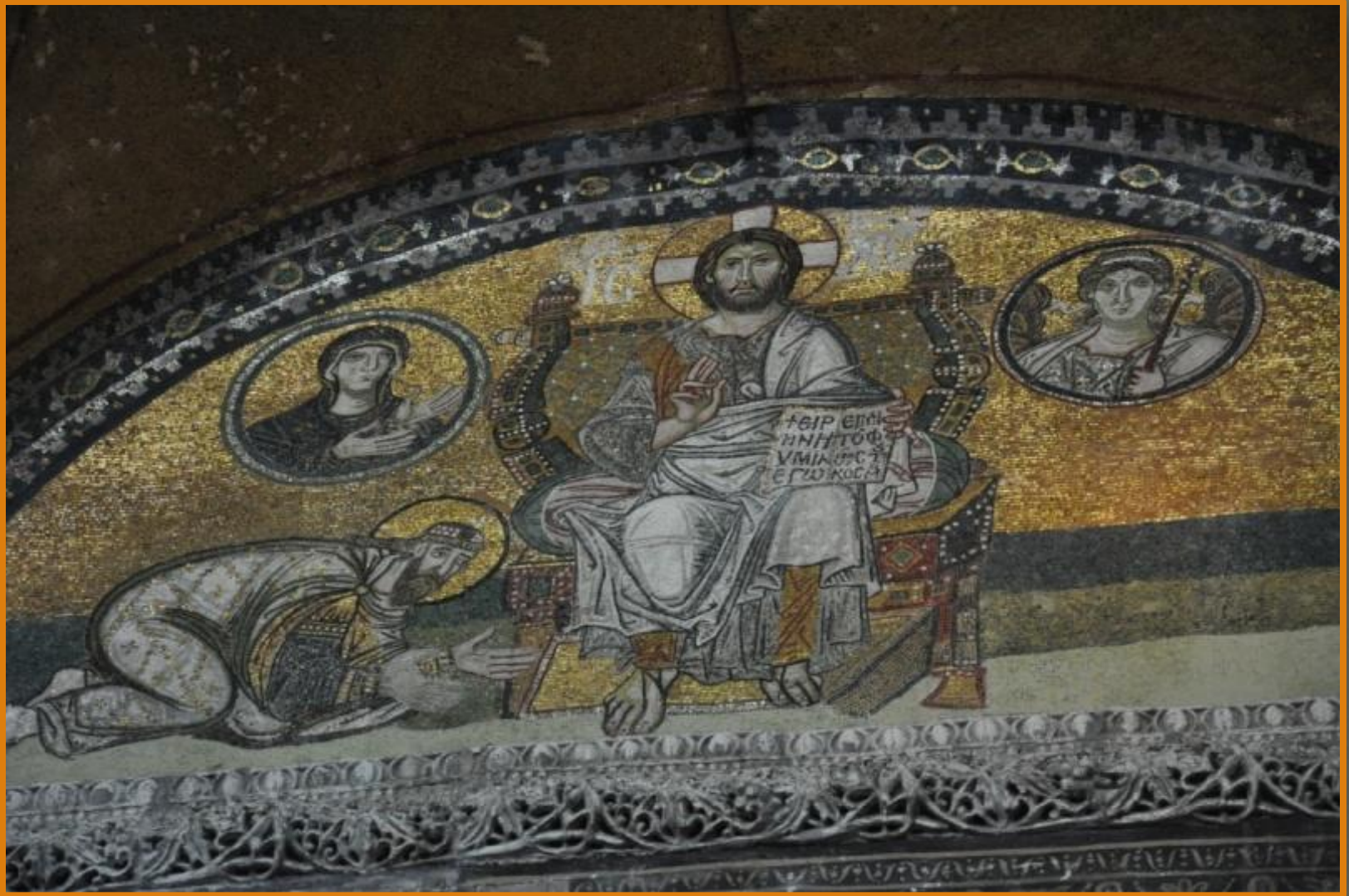
Фрагмент византийской мозаики.