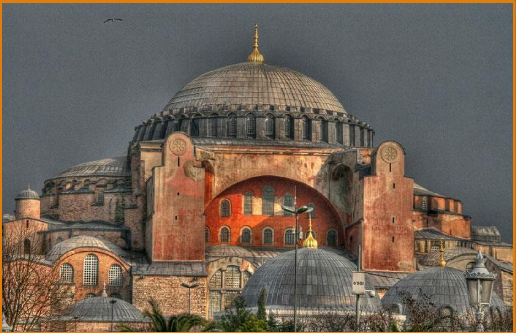
Храм Св. Софии, Константинополь (Стамбул). 532-537 г.г.