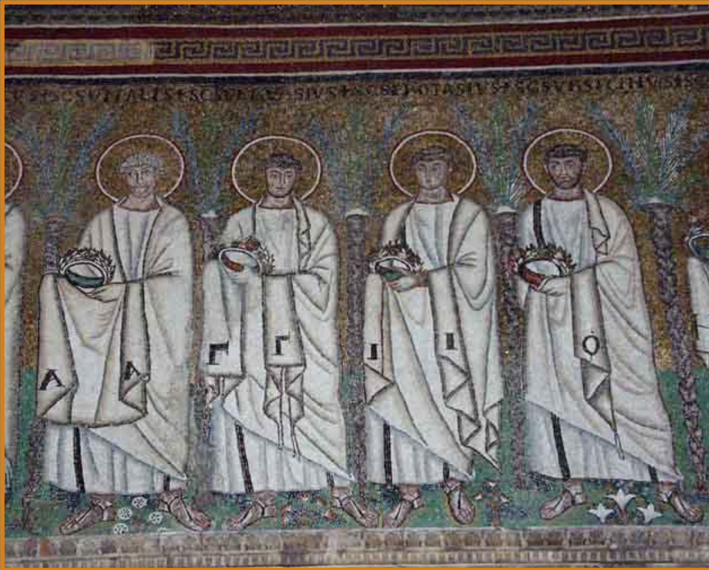
Фрагмент византийской мозаики.