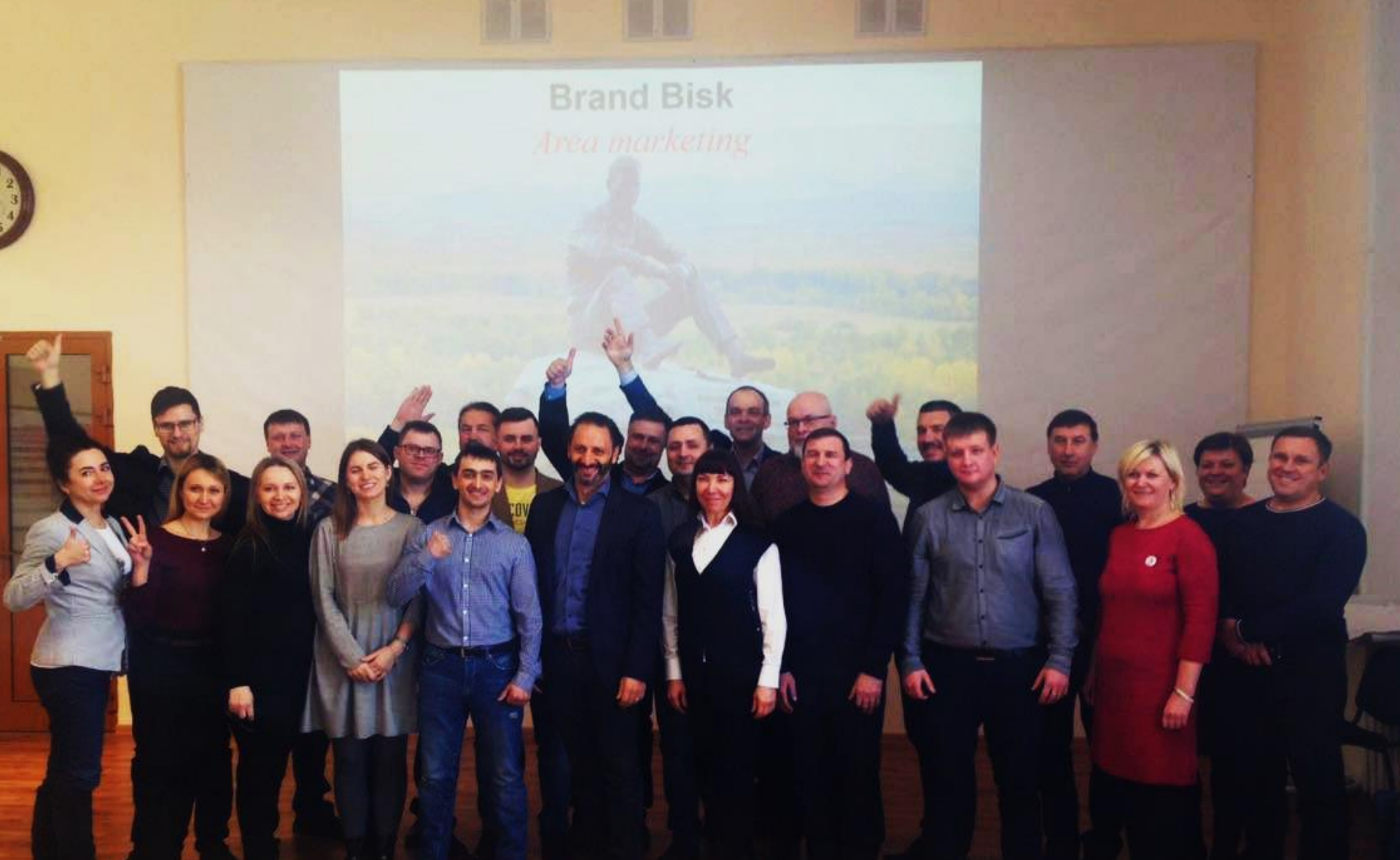
Сообщество предпринимателей Brand Bivsk