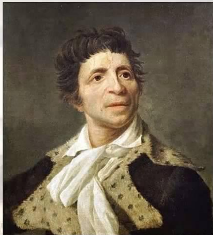
Жан-Поль Марат (1758 – 1794)