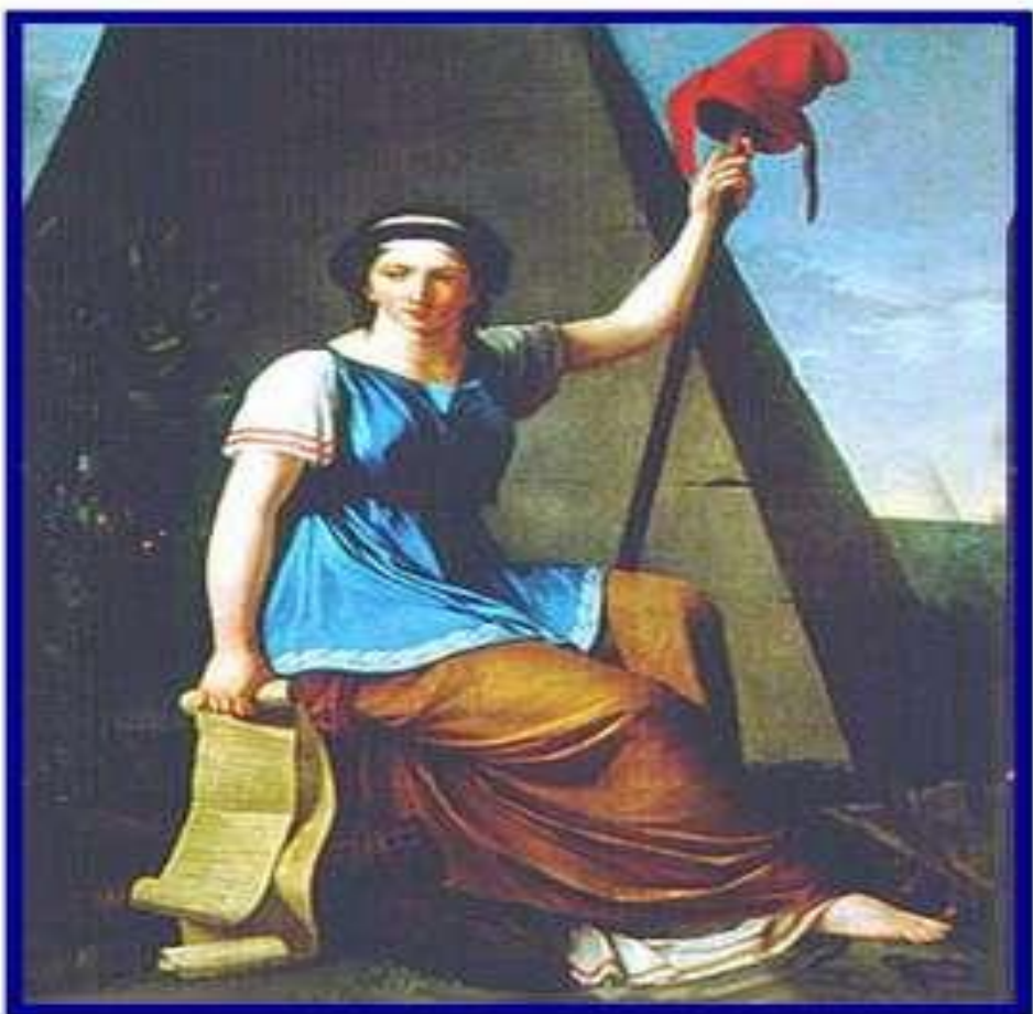
Великая французская революция. Конституция Франции