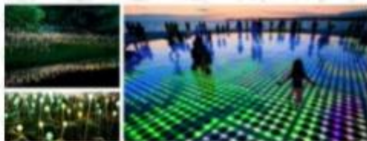
SOLAR ENERGY INSTALLATIONS