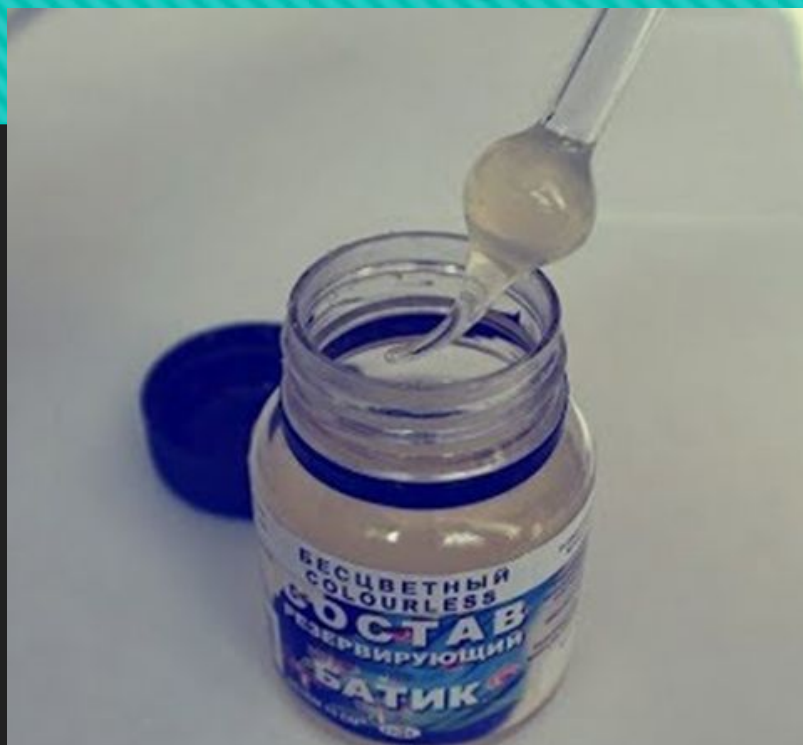
Пипетка для смешивания красок