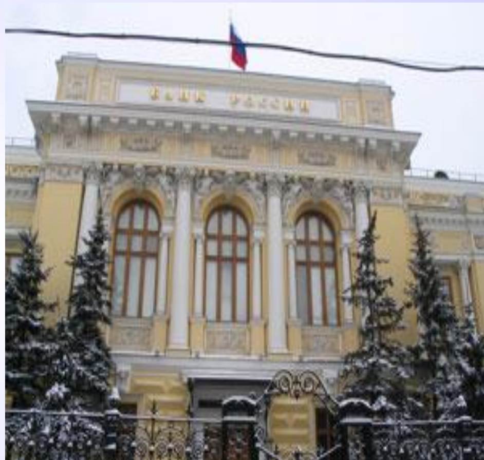
Банк России, Москва

(central bank) — главный банк страны, который имеет исключительное право на эмиссию национальной валюты и контролирует деятельность других банков