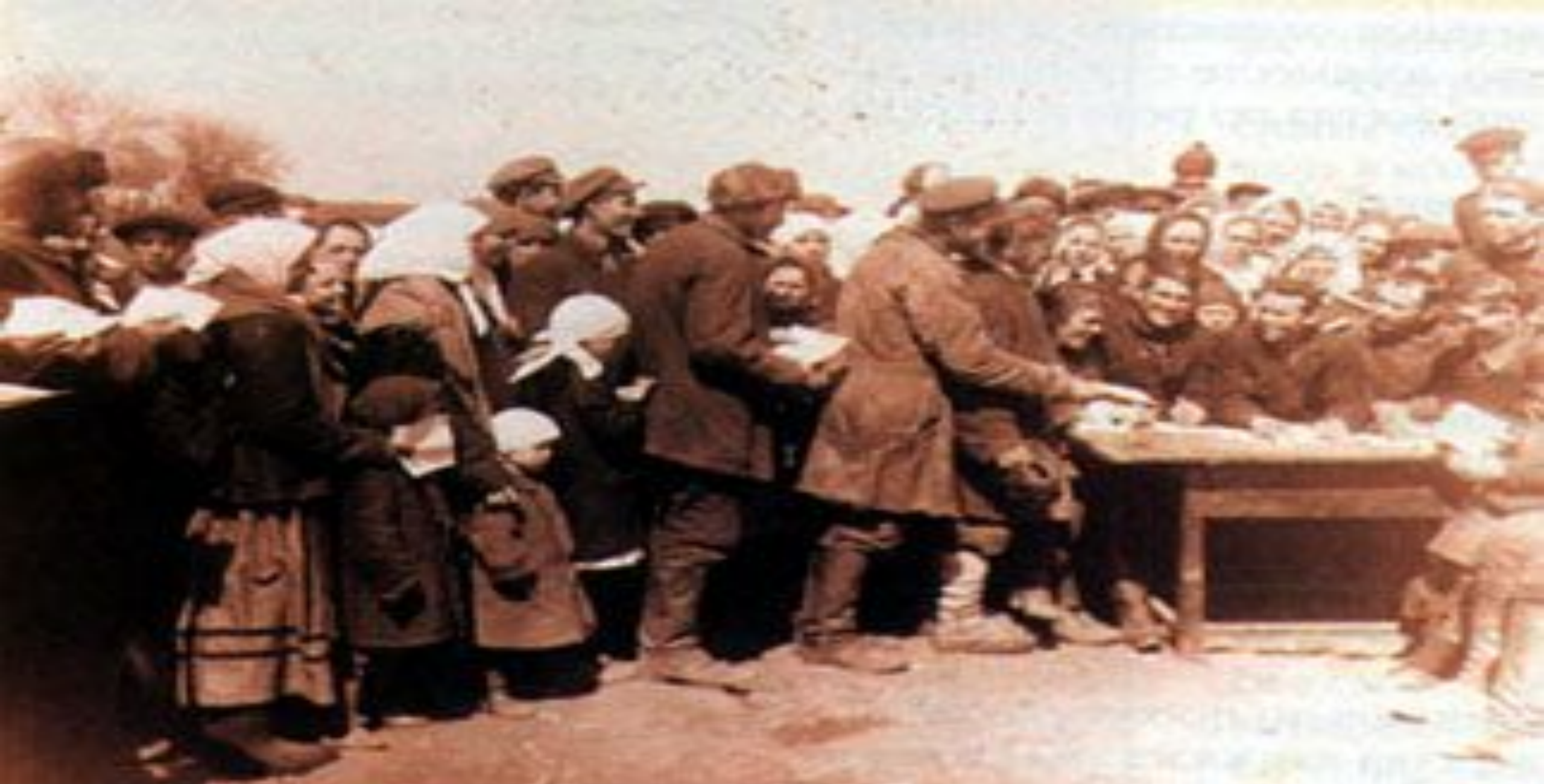
Крестьяне села Чегорошки подают заявления о вступлении в колхоз. 1930 г.