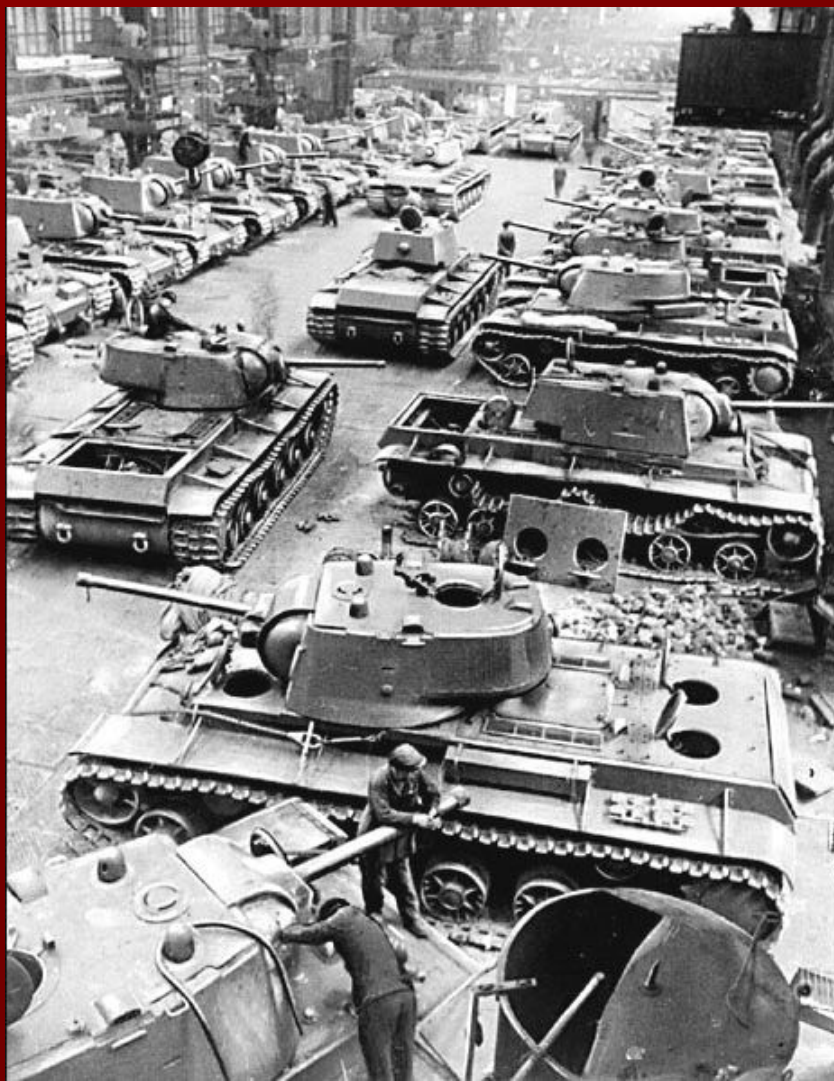
Сборочный цех танкового завода. 1942 год.