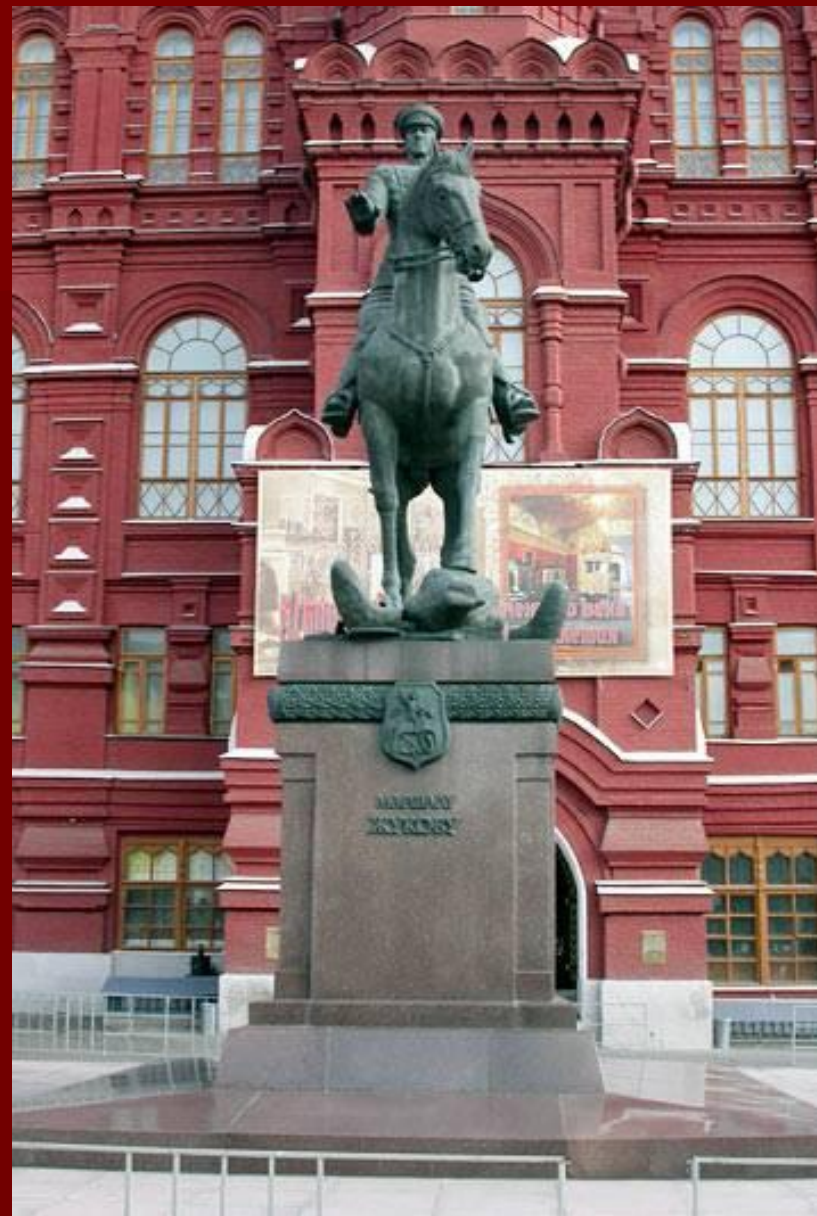
Москва. Памятник маршалу Г. К. Жукову.

Прославленный советский военачальник Г. К. Жуков выиграл за время Великой отечественной войны немало сражений, но самым значимым из них была Берлинская операция.