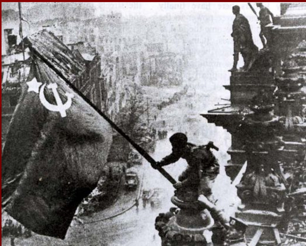
Советские бойцы- разведчики М. Егоров и М. Кантария водрузили Знамя победы над Рейхстагом в Берлине 30 апреля 1945 года.

8 мая 1945 года сдавшиеся фашистские генералы признали полное поражение Германии в войне, Жуков вместе с военачальниками союзников принял капитуляцию Германии.