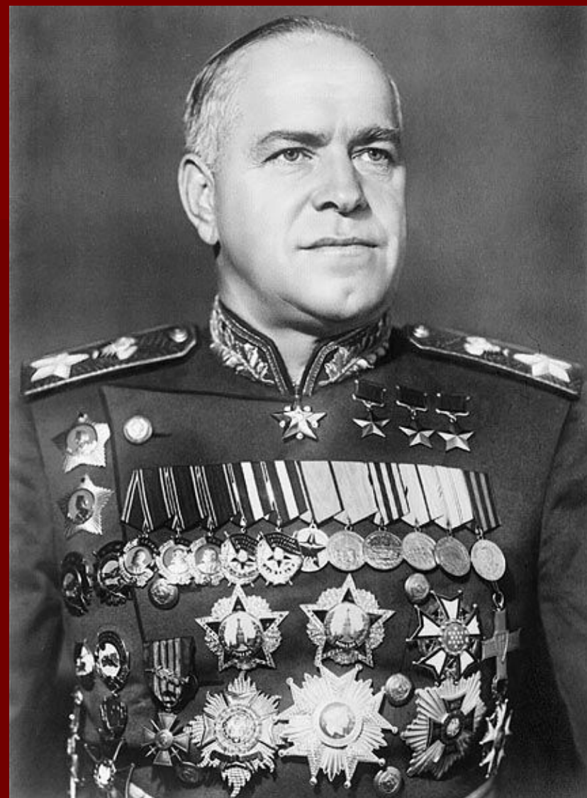
Трижды Герой Советского Союза маршал Г.К. Жуков.

Весной 1945 года советские и союзнические войска вступили на территорию Германии. Началась завершающая Берлинская операция, в которой советскими войсками