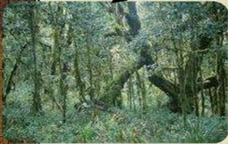
Влажный экваториальный лес