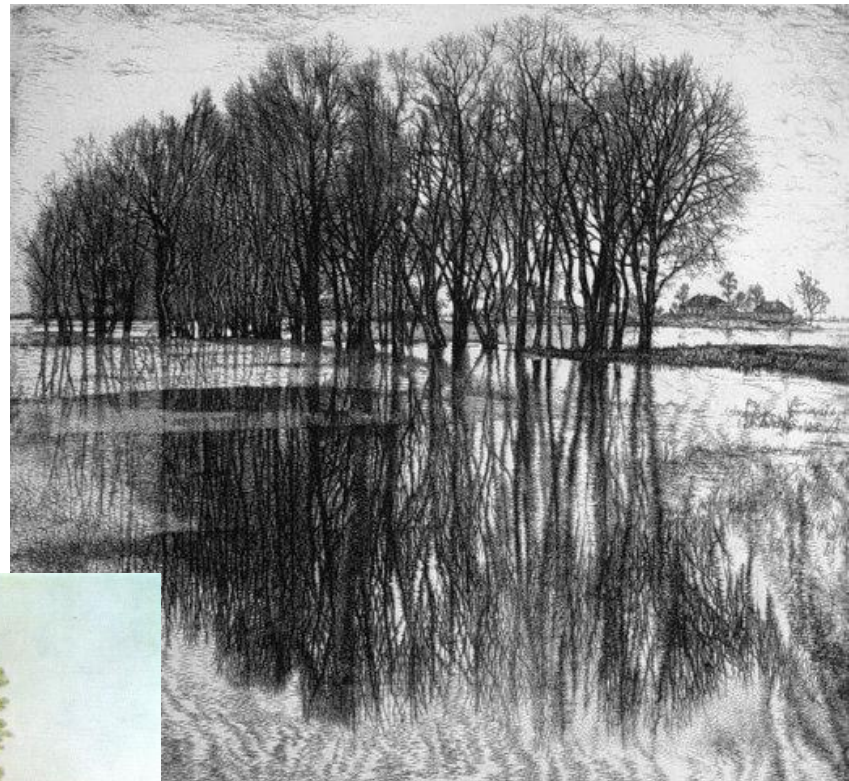
С. Никереев «Весенний разлив» (1999)