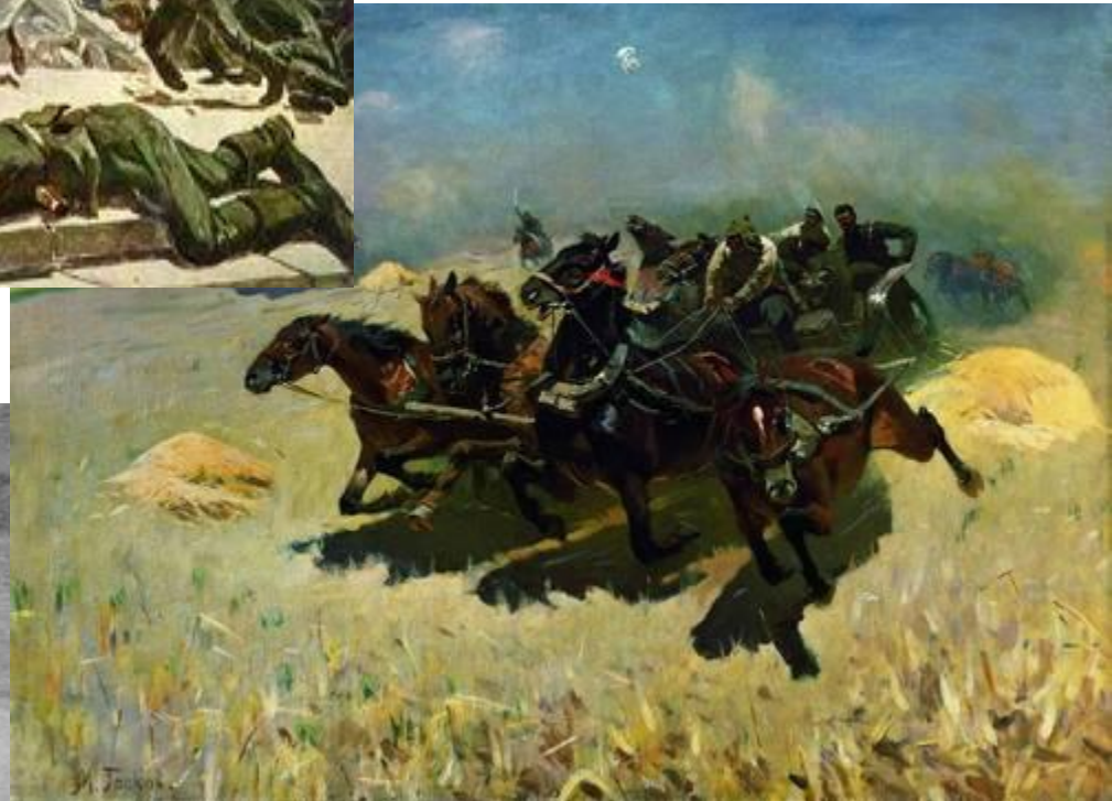
М. Греков «Тачанка»(1925)