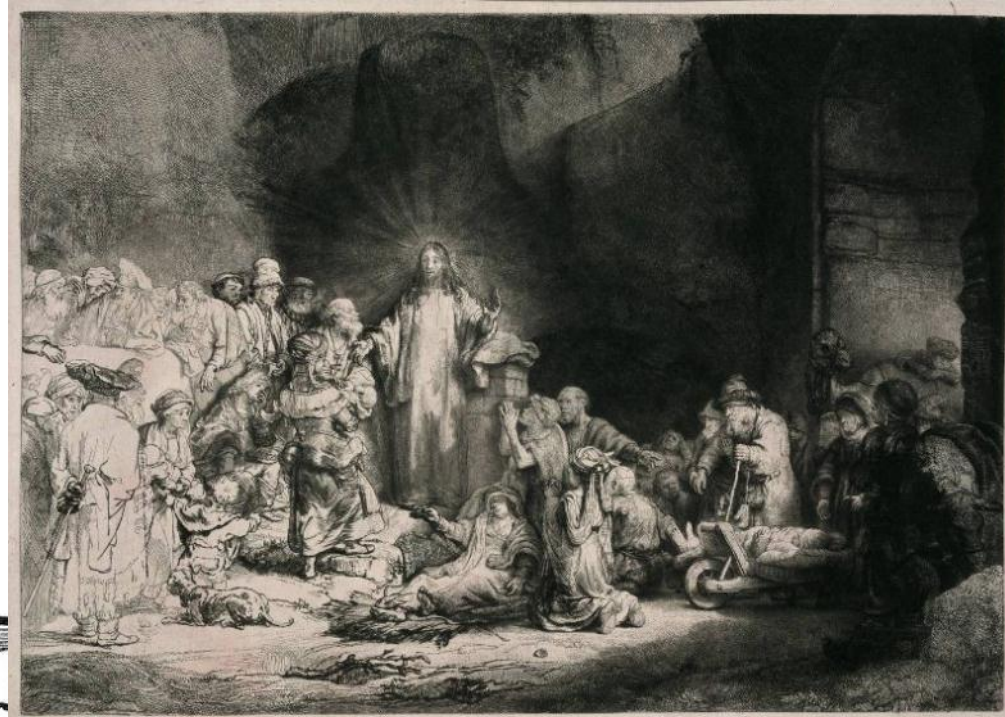
Рембрандт. Офорт «Явление Христа» (1648)