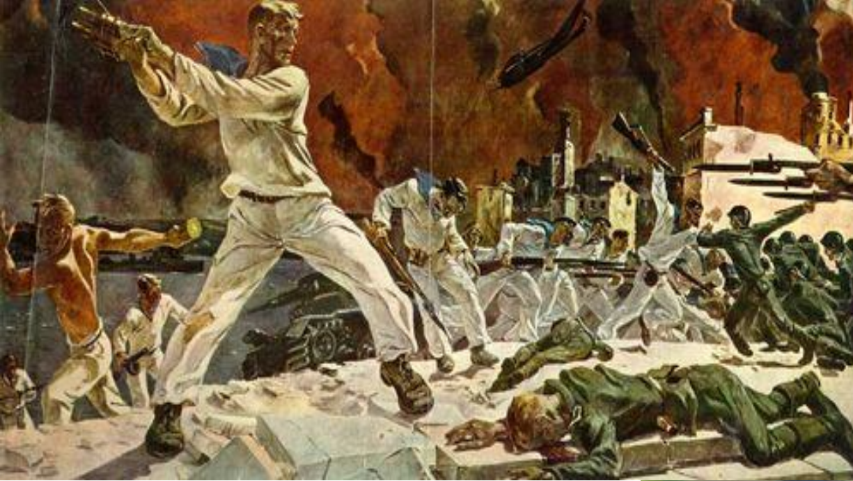
А. Дейнека «Оборона Севастополя» (1942)