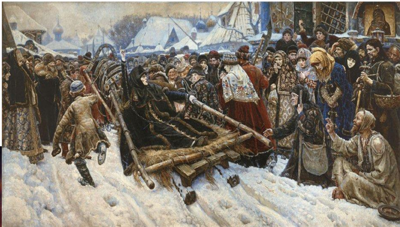
В. Суриков «Боярыня Морозова» (1883)