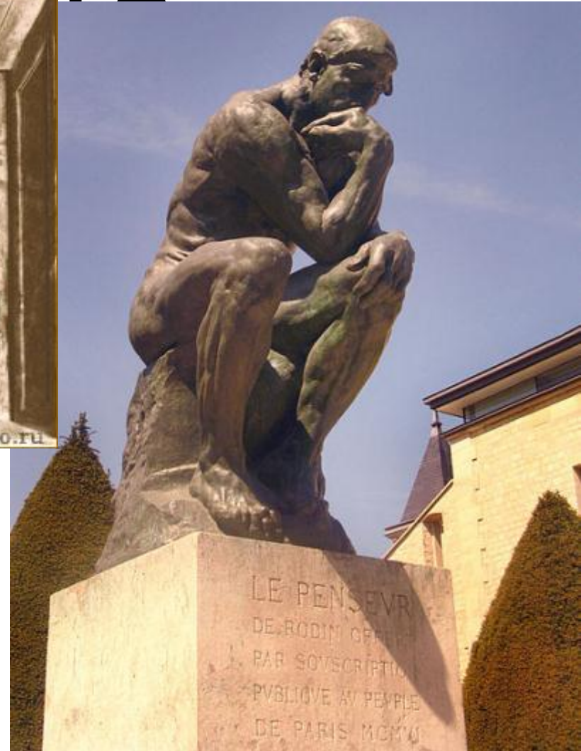
О.Роден «Мыслитель». Бронза