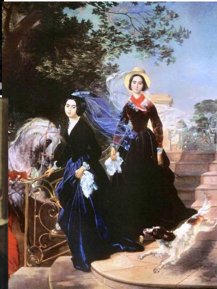
К.Брюллов «Портрет сестер Шишмаревых» (1839)