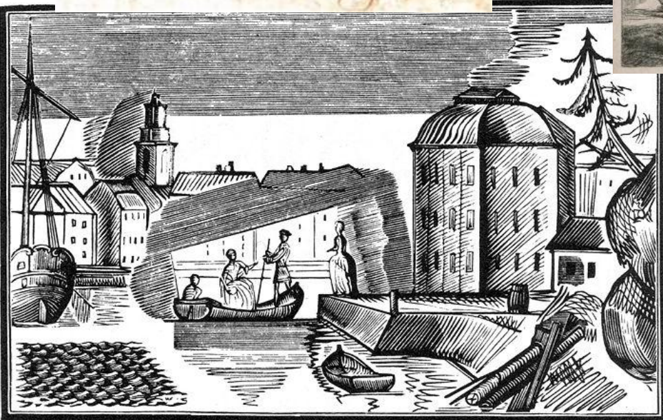
В. Фаворский. Гравюра иллюстрация к роману П. Муратова «Эгерия»(1921)