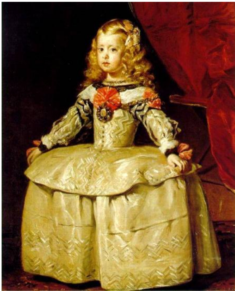
Веласкес. «Портрет инфанты Маргариты». Масло (1654)