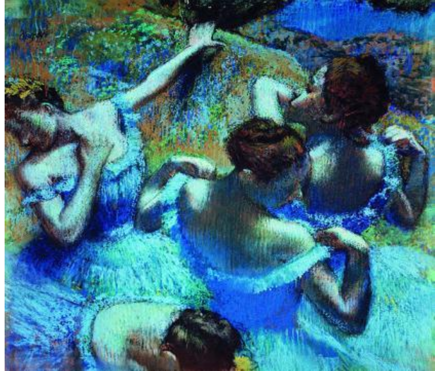
Э. Дега. «Голубые танцовщицы». Пастель (1865)