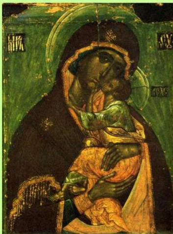
Богоматерь Словенская. Икона. 17 век.