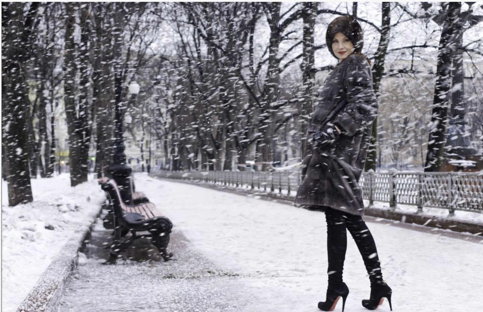
• Рената Литвинова, 2008