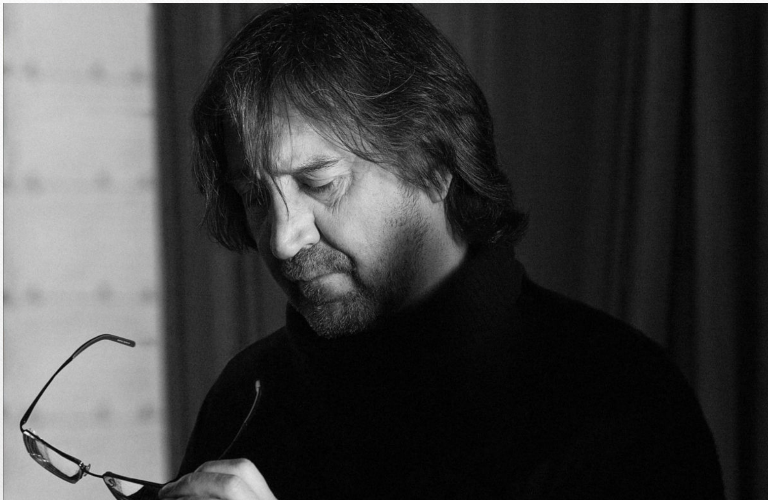
• Юрий Шевчук, 2008