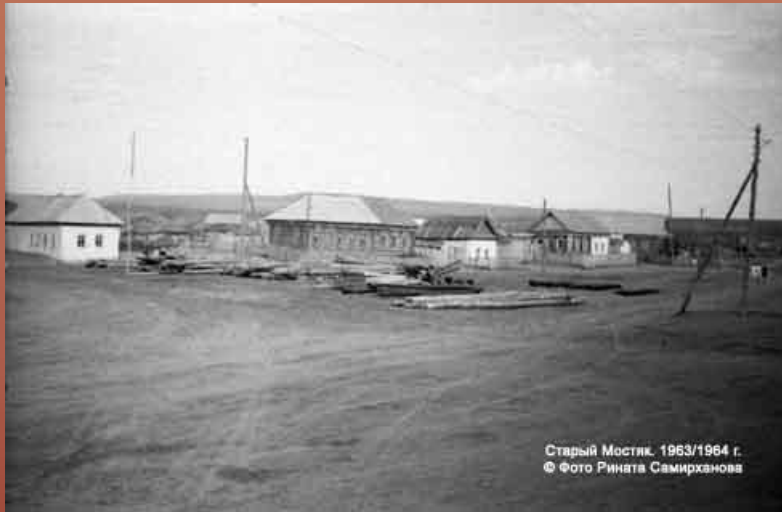
Старый Мостяк. 1963/1964 г.