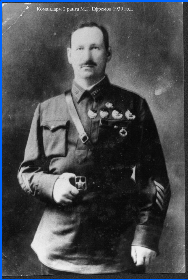
Командарм 2 ранга М.Г. Ефремов 1939 год.

Великая Отечественная война прочно связала имя М.Г. Ефремова с судьбой 33-ей армии.