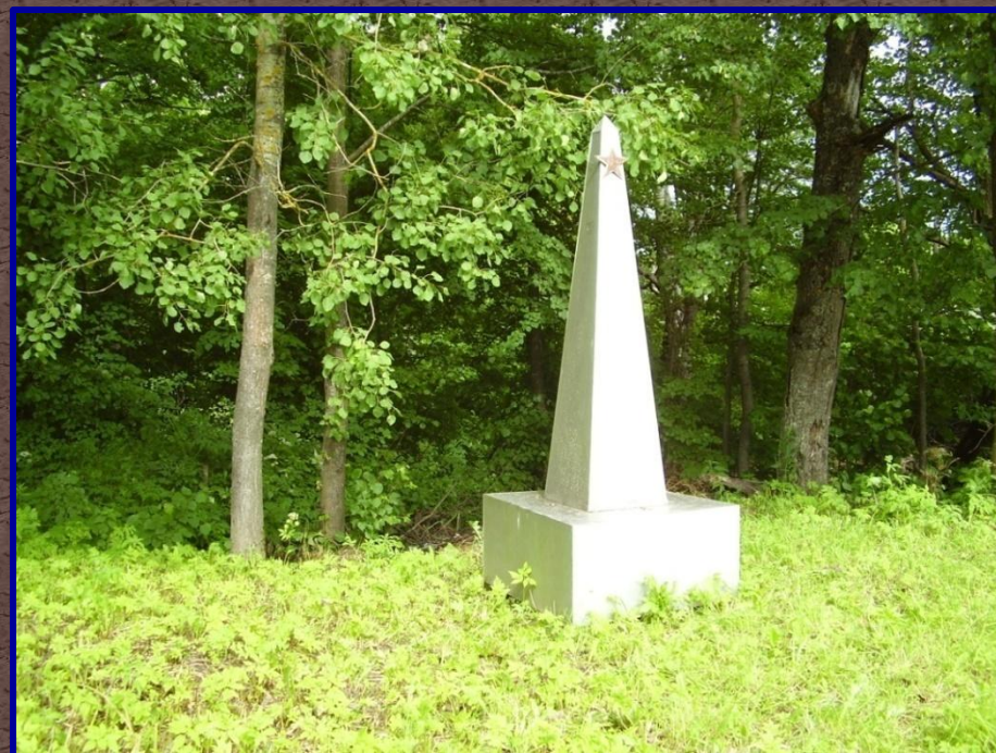
Желтовка - место последнего штаба 33-ей армии

Оборону 33-ей армии по праву считают подвигом.