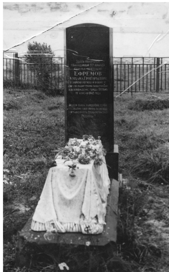
ФОТО 1952 года

Могила М.Г. Ефремова на Екатерининском кладбище в городе Вязьма.