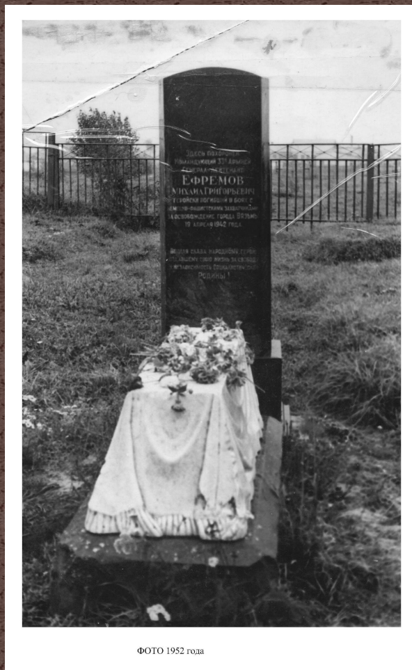
ФОТО 1952 года