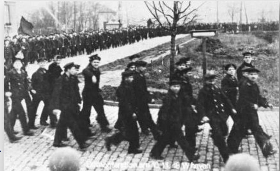
Демонстрация моряков в Киле