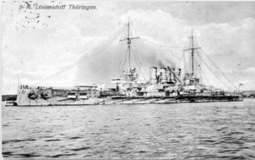
Линкор "Тюрингия" - один из первых, поднявший красный флаг