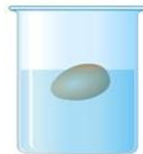
Яйцо в соленой воде

Опыт, показывающий поведение яйца в пресной и соленой воде