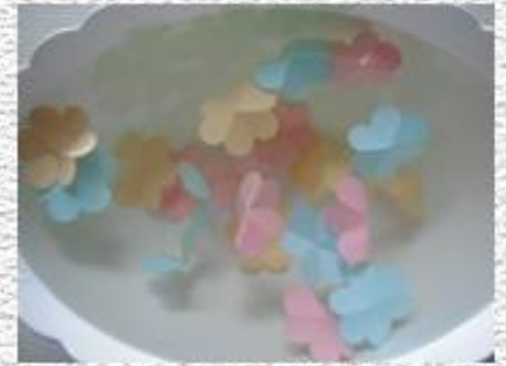
через 2 мин