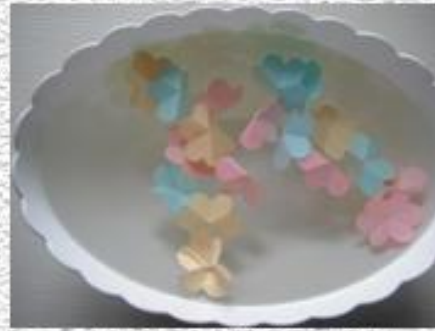
через 30 с