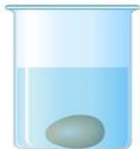
Яйцо в пресной воде