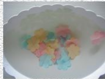
через 10 мин