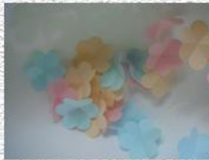
через 5 мин