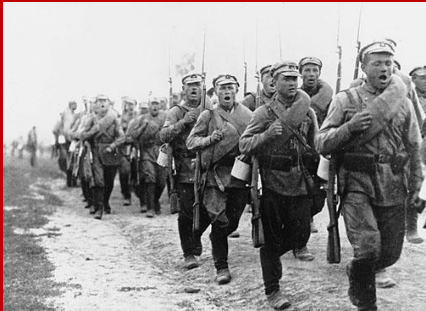
подразделение РККА на марше. 1920 год.

В ходе Великой Отечественной войны указанная должность подверглась переименованию в Главный инспектор Пехоты Красной Армии с расширением обязанностей и прав. Официально данная должность учреждена Приказом Народного комиссара обороны СССР Маршала Советского Союза И. Сталина № 270/0381 от 25 ноября 1944 года .