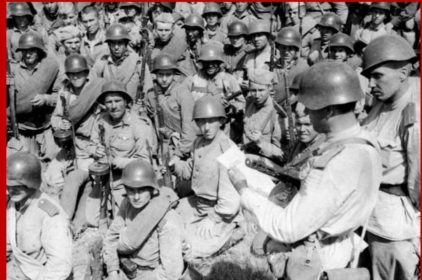
Пехотные войска РККА, «Перед началом наступления », Солдаты читают боевой приказ перед началом наступления, 3 сентября 1943 года .