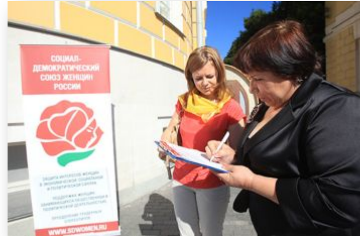
Участие «по совместительству»