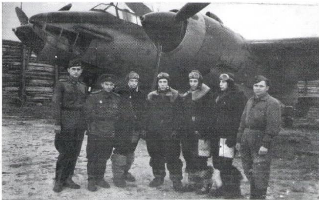
Летный и технический состав после выполнения боевого задания. 1945 год.