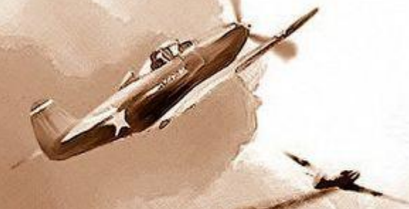
Александр Фёдорович КЛУБОВ 1918–1944 ЛЁТЧИК-ИСТРЕБИТЕЛЬ