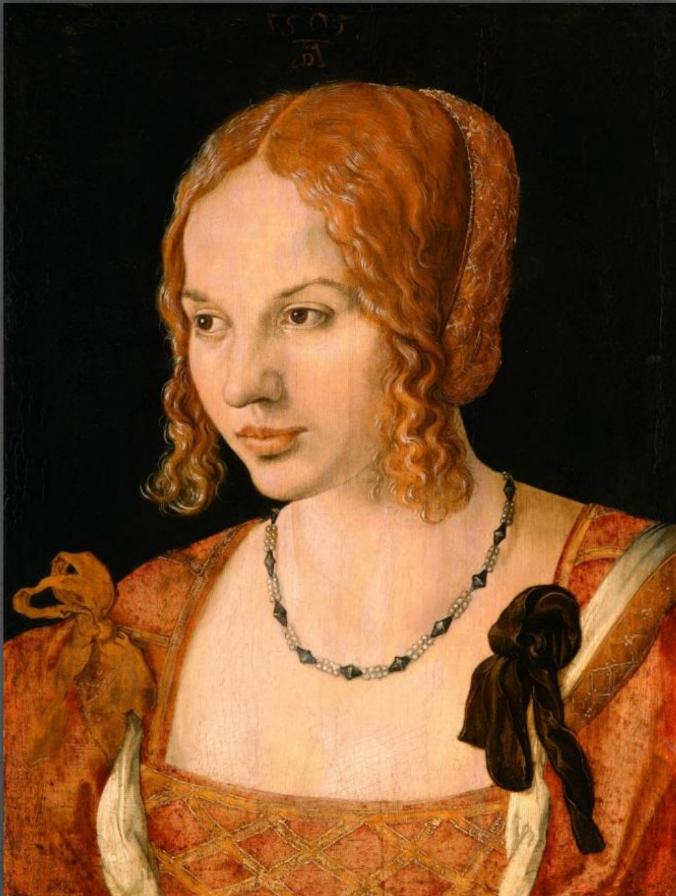
Портрет венецианки. Государственные музеи, г. Берлин. Ок. 1506 г.