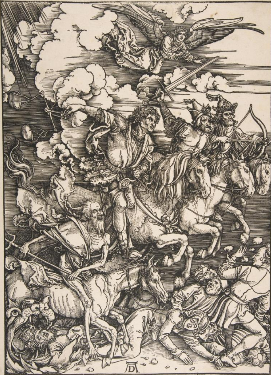
Четыре всадника Апокалипсиса. Серия Апокалипсис. Государственный кунстхалле, г. Карлсруэ. 1498 г.