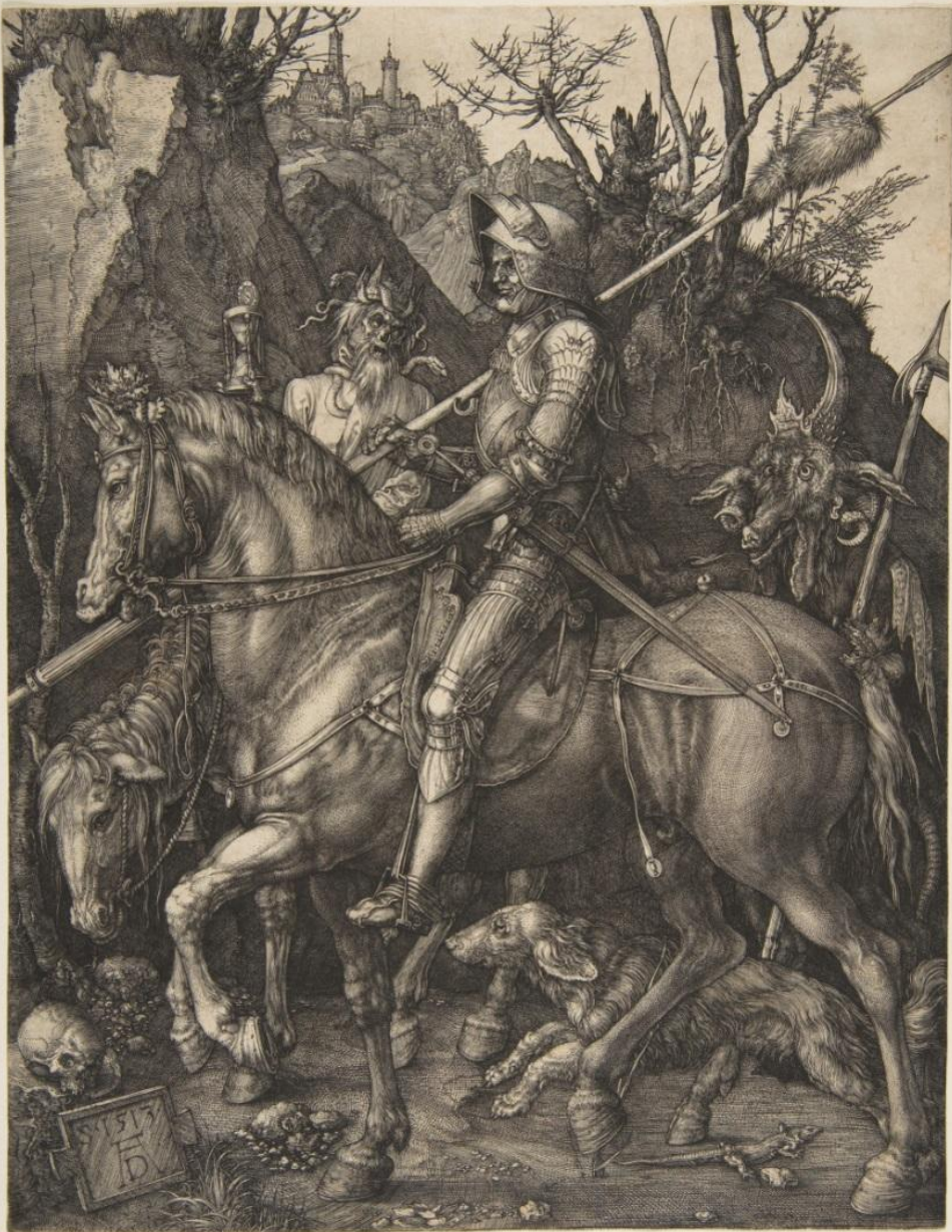
Рыцарь, дьявол и смерть. Цикл Мастерские гравюры. Метрополитен-музей, г. Нью-Йорк. 1513 г.