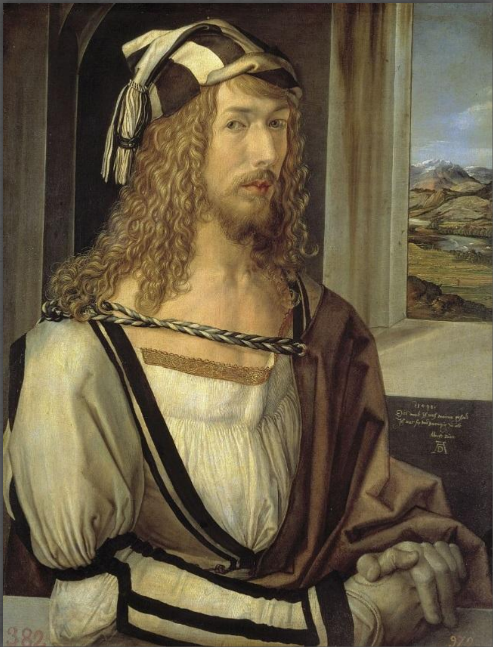
Автопортрет. Национальный музей Прадо, г. Мадрид. 1498 г.