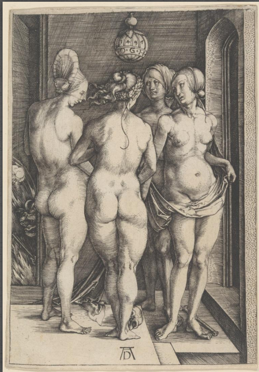
Четыре ведьмы. Музей изобразительных искусств, г. Будапешт. 1497 г.