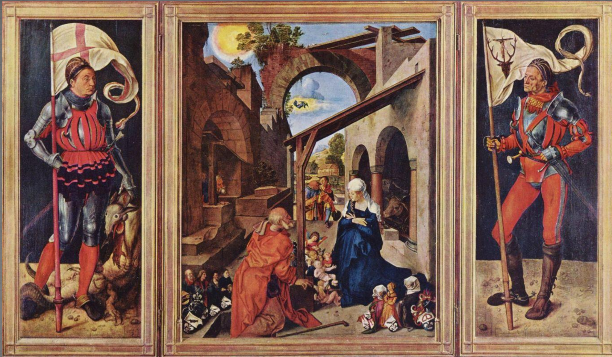
Алтарь Паумгартнеров. Старая Пинакотека, г. Мюнхен. Ок. 1503 г.