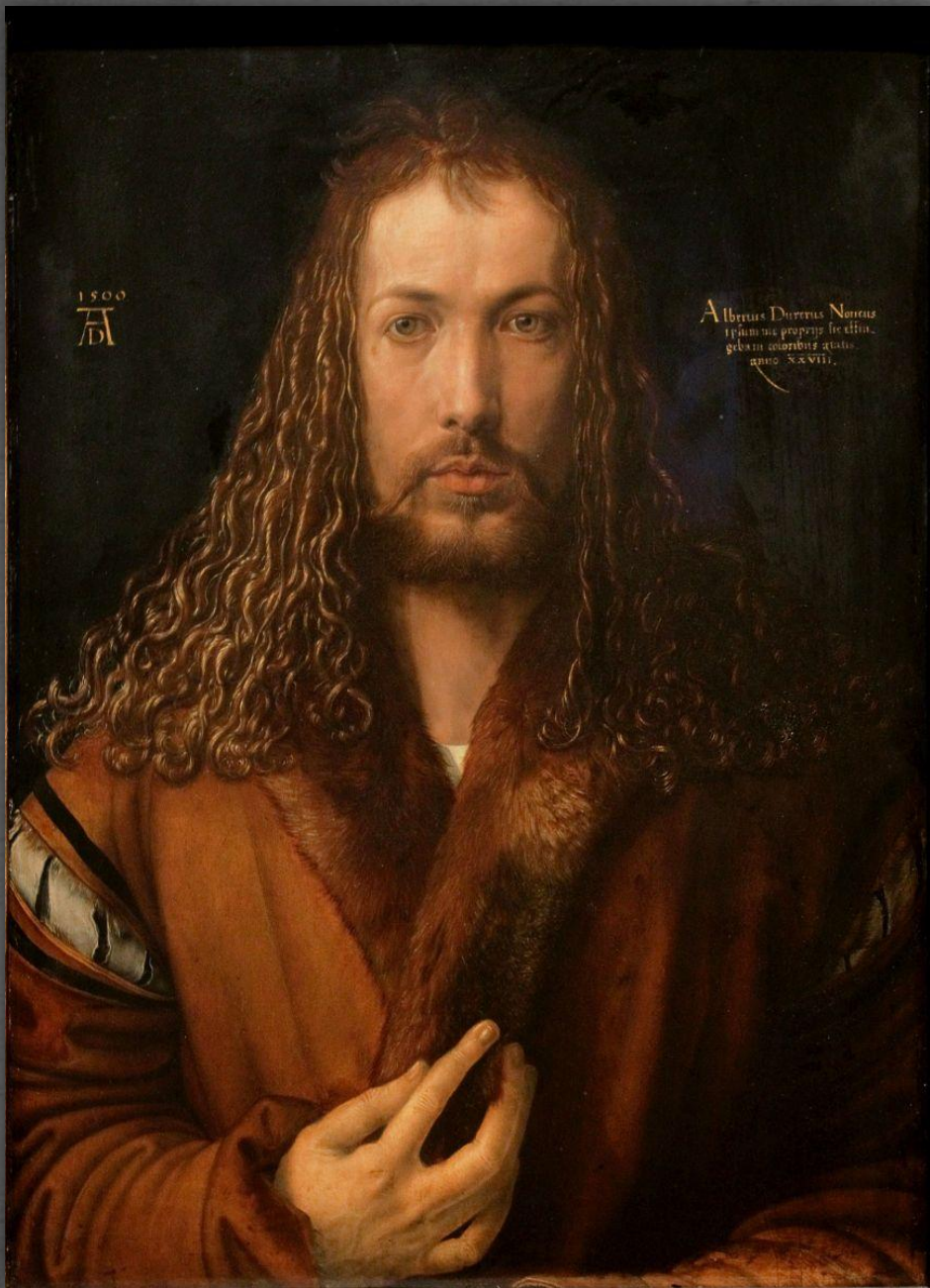
Автопортрет. Старая Пинакотекка, г. Мюнхен. 1500