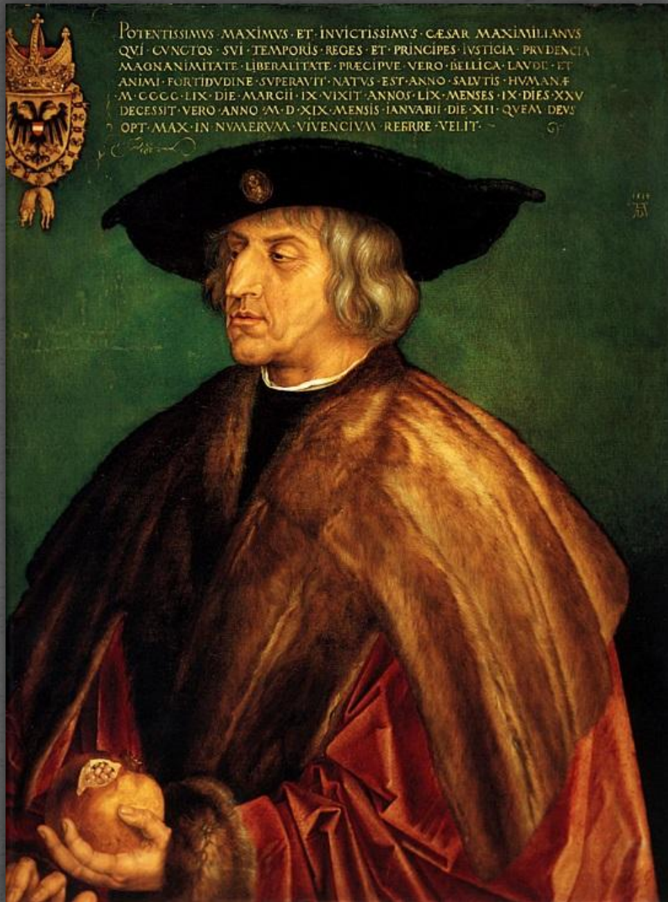
Портрет императора Максимилиана I. Музей истории искусств, г. Вена. 1518 г.