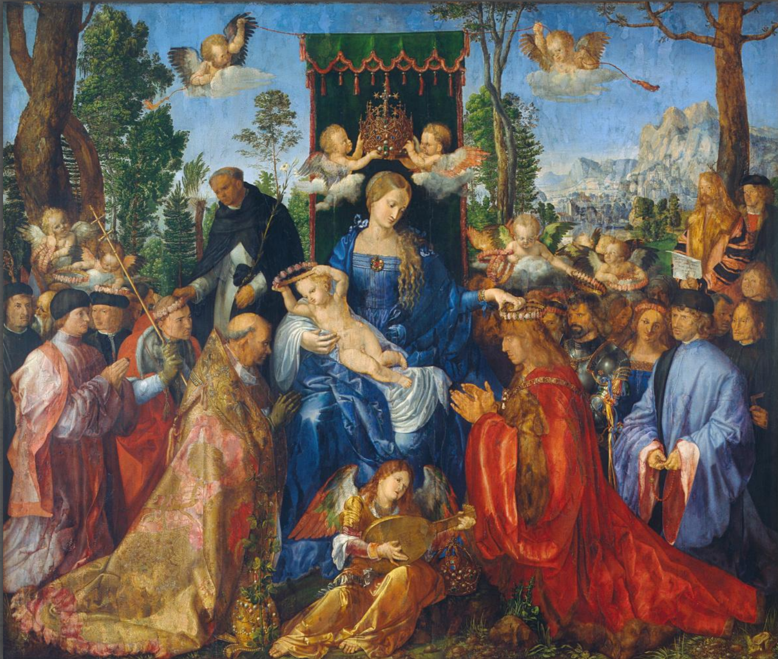
Праздник чётков. Национальная галерея, г. Прага. 1506 г.