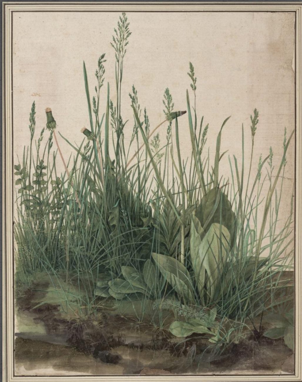
Трава (Кусок дёрна). Галерея Альбертина, г. Вена. 1503 г.