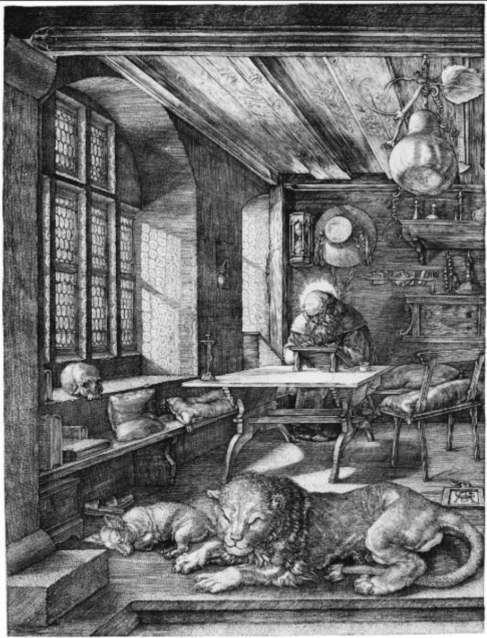
Святой Иероним в келье. Цикл Мастерские гравюры. Британская библиотека, г. Лондон. 1514 г.