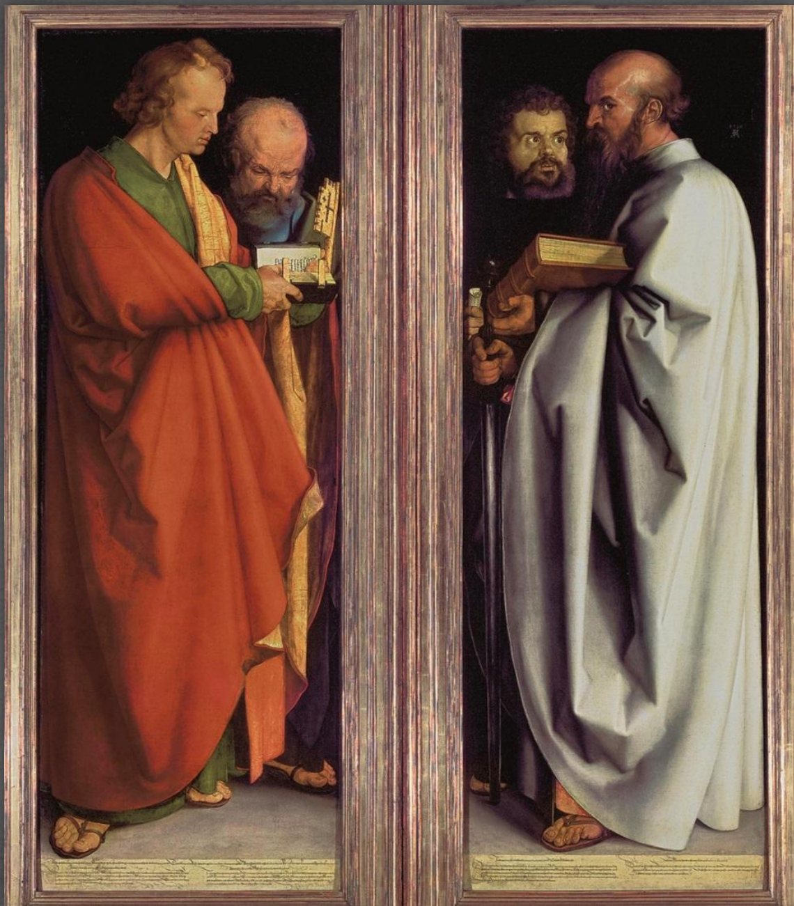
Четыре апостола. Старая Пинакотека, г. Мюнхен. 1526 г.