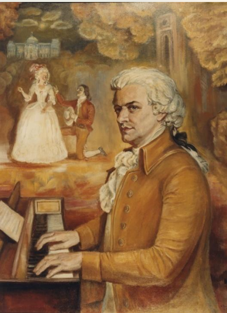
Вольфганг Амадей Моцарт