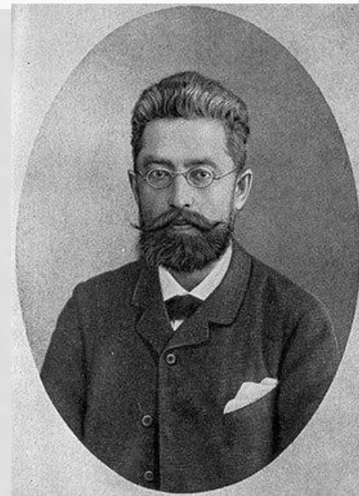
В. Х. Кандинский