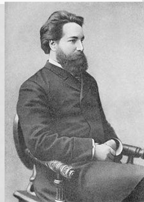
С. С. Корсаков