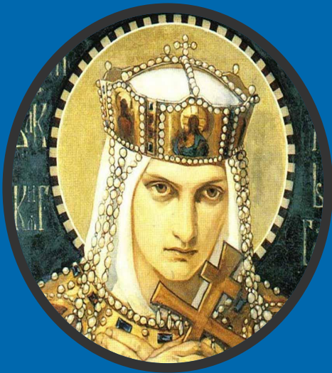
1 княгиня Ольга