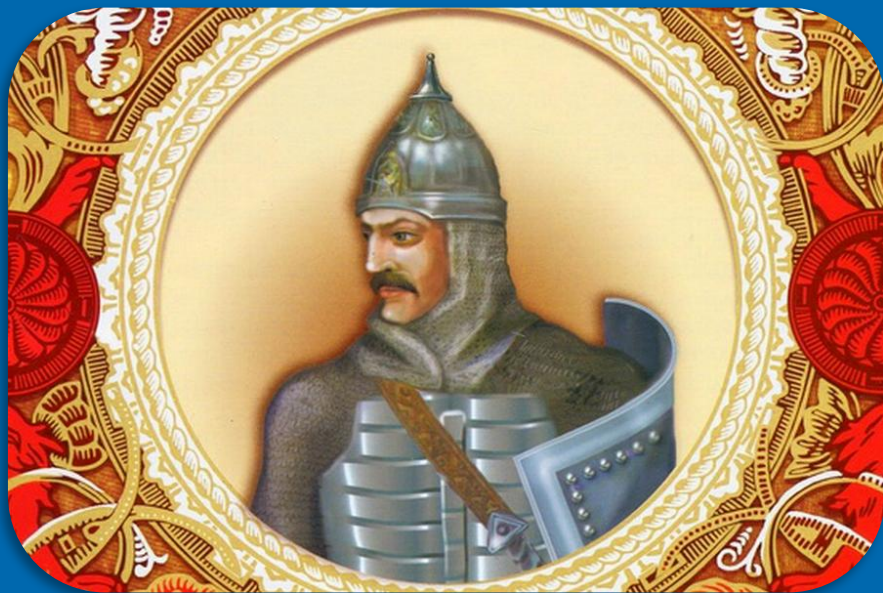
1 Вещий Олег