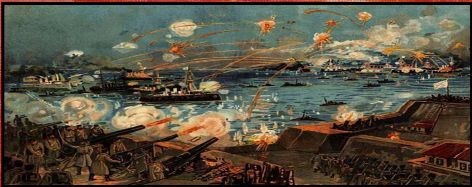
Морское сражение у Порт-Артура. Литография, 1904 г.

Душой обороны крепости был талантливый военачальник генерал Роман Кондратенко. Он понимал, что, пока держится Порт-Артур и сохранён флот, Россия может рассчитывать на победу в войне, поэтому делал всё возможное, чтобы отстоять крепость. 2 декабря Кондратенко погиб. Вскоре после этого начальник Квантунского укрепленного района Стессель, невзирая на протесты многих офицеров и недовольство солдат, подписали акт о капитуляции, хотя возможности обороны не были исчерпаны. 157 дней держалась крепость. Она отвлекала огромные силы противника, не давая ему возможности продолжить наступление в Маньчжурии. В боях за Порт-Артур погибли многие представители старинных самурайских принцев. Немалые потери понес при осаде и неприятельский флот. Падение Порт-Артура вызвало взрыв негодования в России, приблизив начало первой русской революции.»