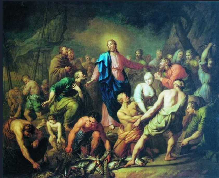
“Чудесный улов рыбы” А.П. Лосенко

Постепенно русская живопись начинает обрастать национальными особенностями. На полотнах начинают появляться сюжеты из русской истории , наряду с библейскими персонажами героями картин становятся былинные богатыри, не уступая первым в накале страстей. Портретное искусство во второй половине 18 века обретает новое дыхание с приходом новых мастеров живописи.