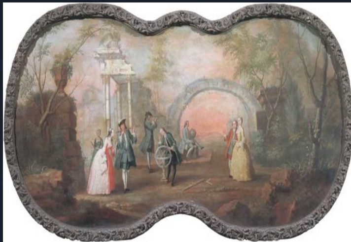
Борис Суходольский. Живопись. 1754. Холст, масло. 100 x 208 см. Государственный Русский музей