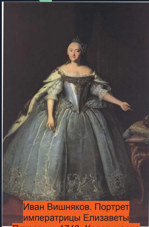
Иван Вишняков. Портрет императрицы Елизаветы Петровны, 1743. Холст, масло 254 x 179,8 см. Государственная Третьяковская галерея