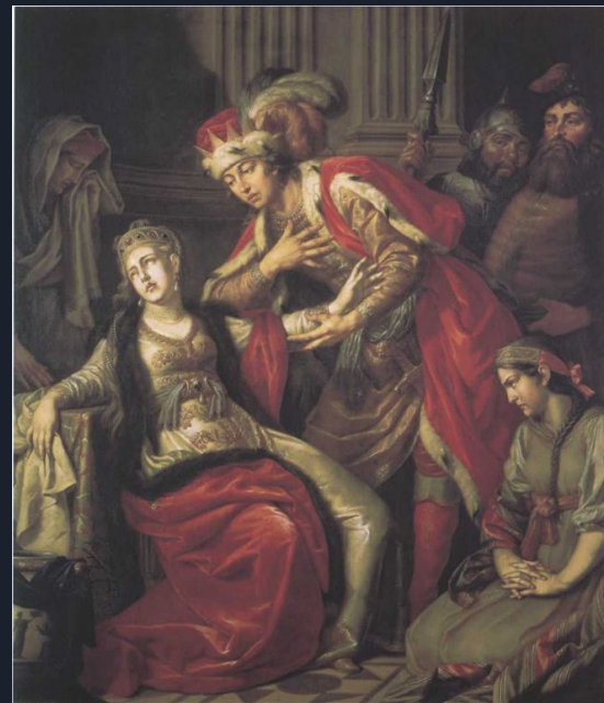
Антон Лосенко. Владимир и Рогнеда. 1770. Холст, масло. 211,5 x 177,5 см. Государственный Русский музей