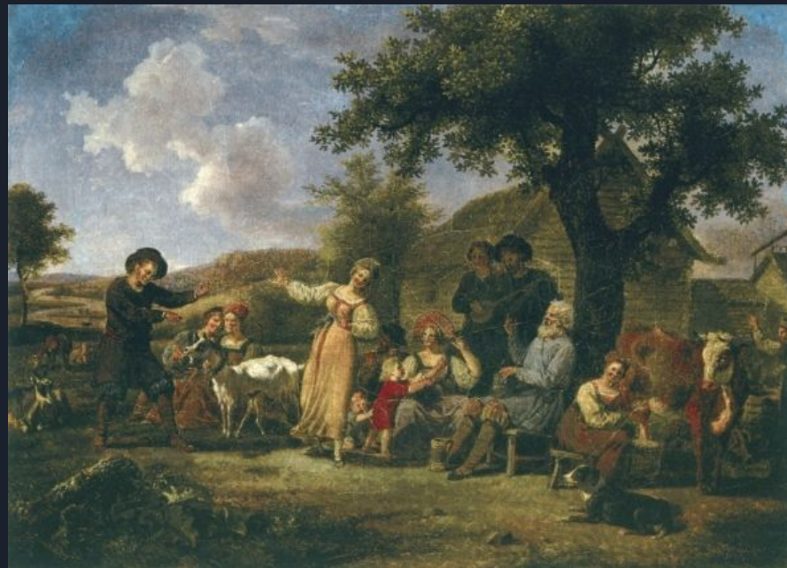
“Праздник в деревне” 18в. Неизвестный художник

К концу столетия в русской живописи начинает зарождаться новый жанр – бытовой . И его главным героем становится простой народ и, конечно, русское крестьянство.