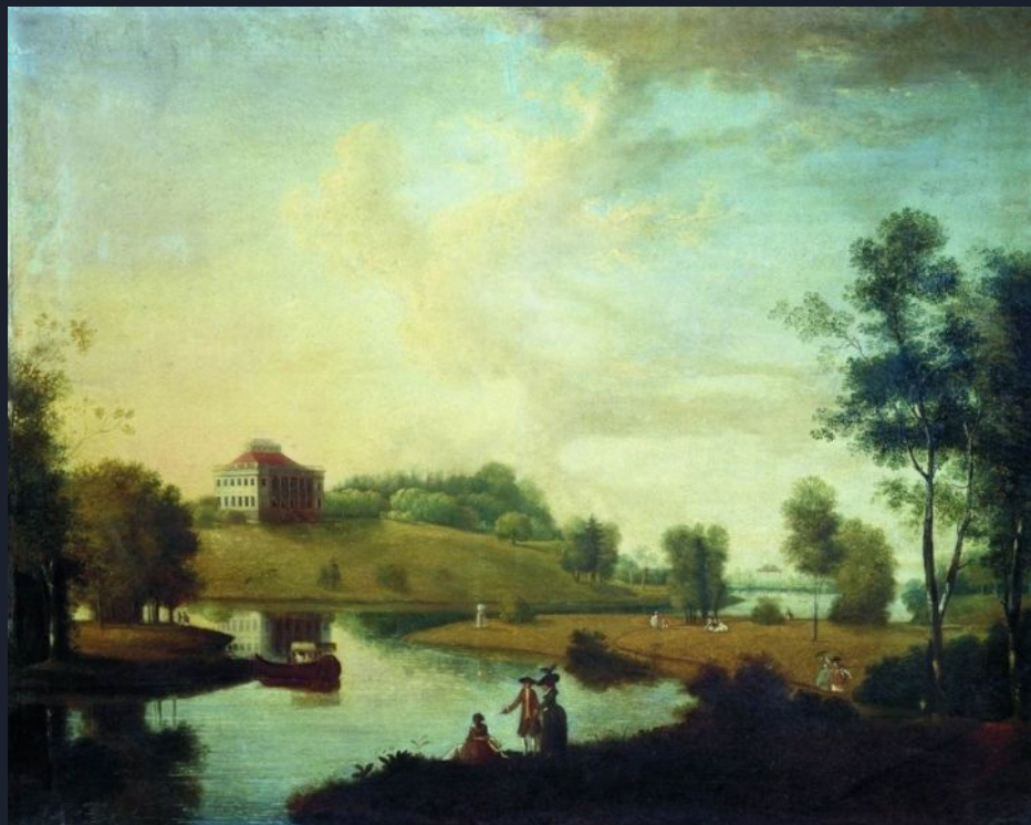
Вид в усадьбе П.Г. Демидова «Сиворцы» под Петербургом 1792 год. Художник Щедрин Семен Федорович (1745–1804)

В конце 18 века еще одно направление русской живописи выделяется в самостоятельное – это пейзаж . Художники начинают рассматривать природу как ценность, достойную отдельного изображения. Тогда как ранее природные фоны использовались только как украшение заднего плана картины.