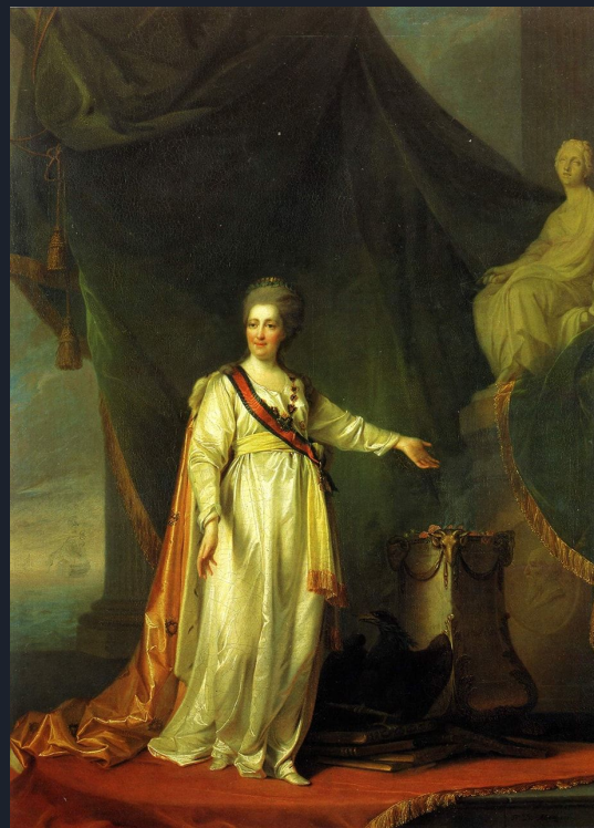
Портрет Екатерины II в виде законодательницы в храме Богини правосудия

Русская живопись после петровских преобразований 18 века претерпевает еще большие изменения. Иностранные художники начинают приезжать в Россию и работать при дворе. Русская живопись врывается в мировое искусство и за несколько десятилетий 18 века проходит такой путь, который Европа прошла до этого за несколько веков.