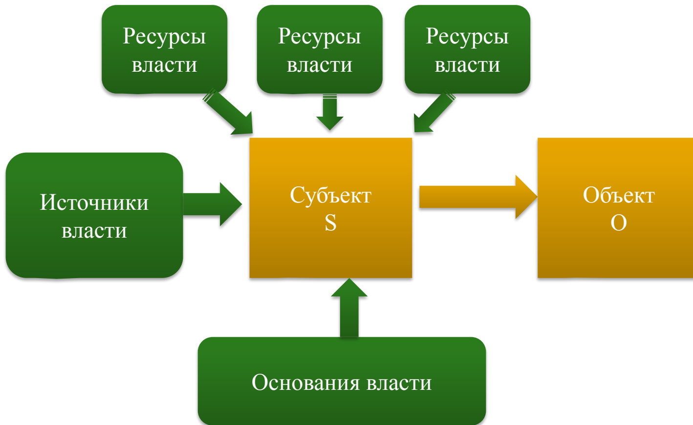
Схема структуры власти