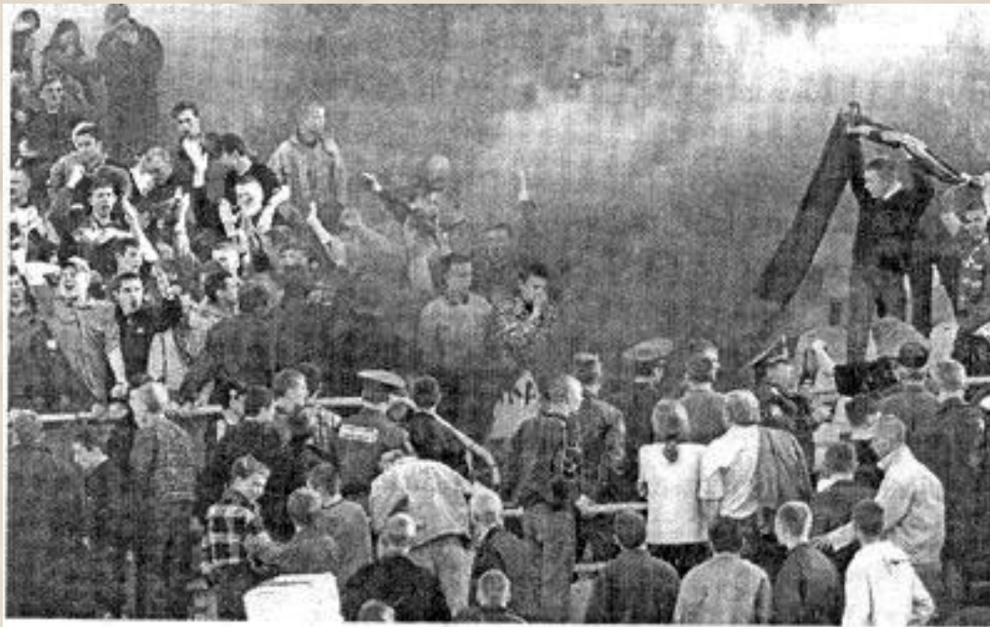
Экспрессивная толпа, превращающаяся в агрессивную.