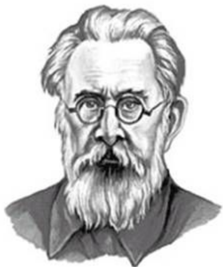
В. И. Вернадский (1863-1945)

Выдающийся русский ученый Академик, основоположник науки геохимии Создал учение о биосфере Земли.