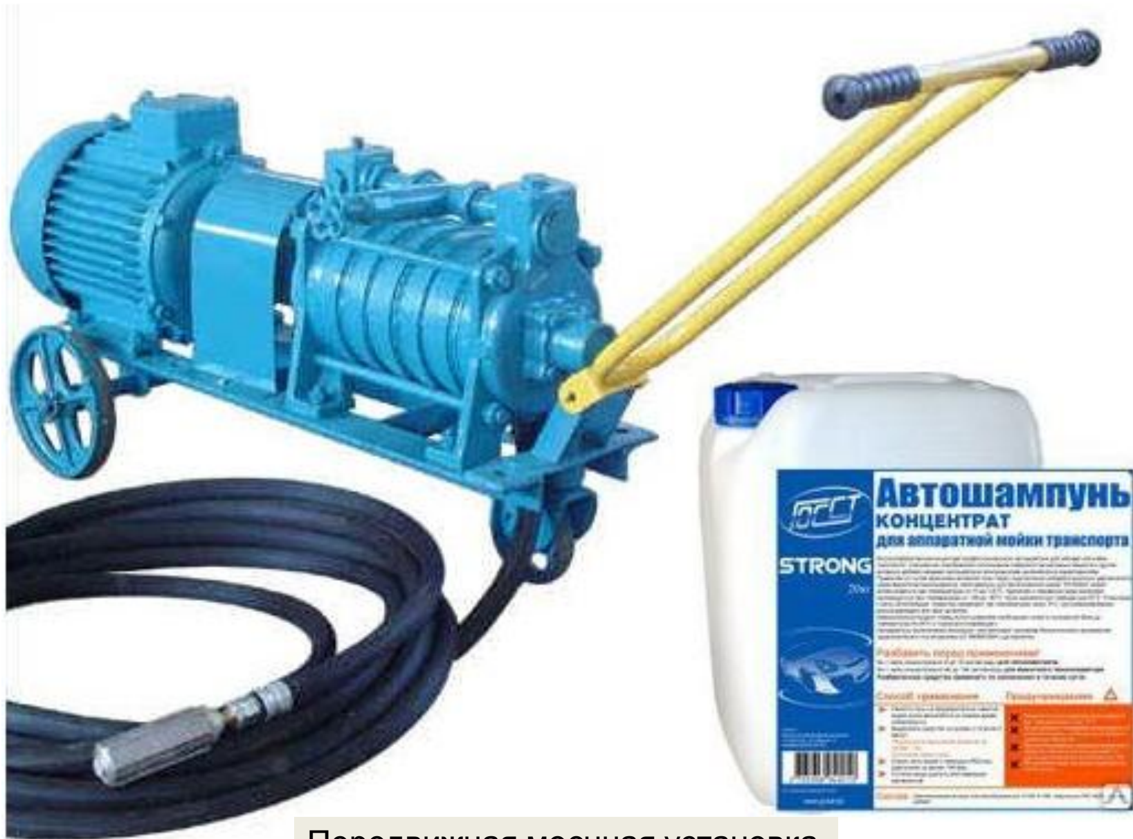
Передвижная моечная установка