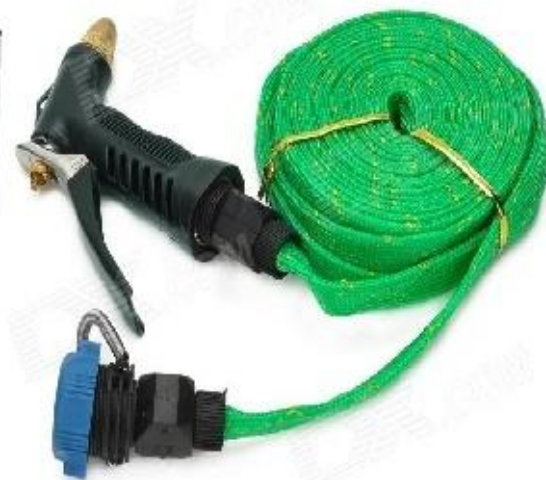
Стационарная моечная установка