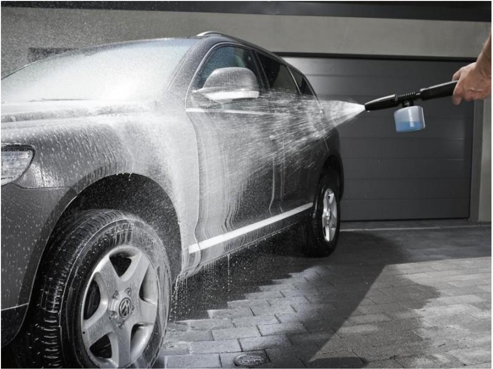
Ручная шланговая мойка автомобиля