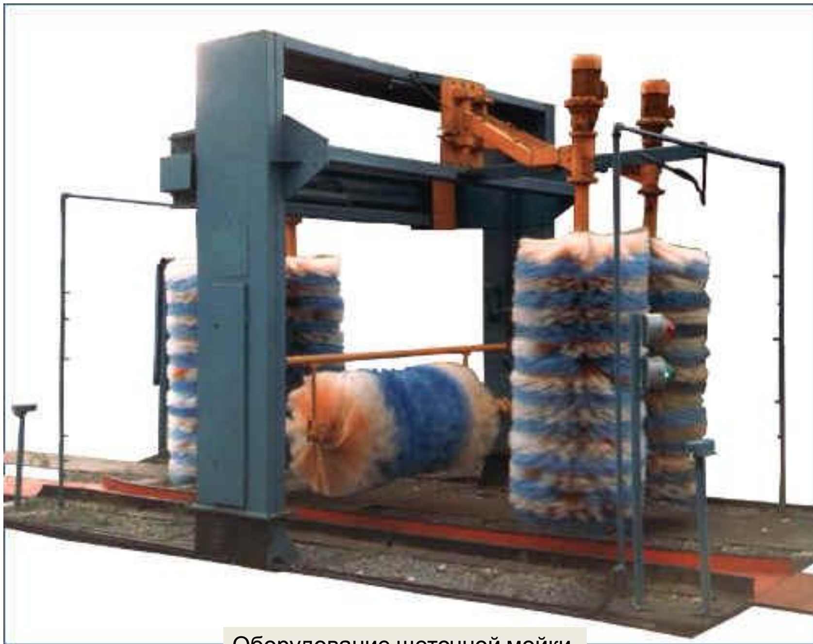
Оборудование щеточной мойки