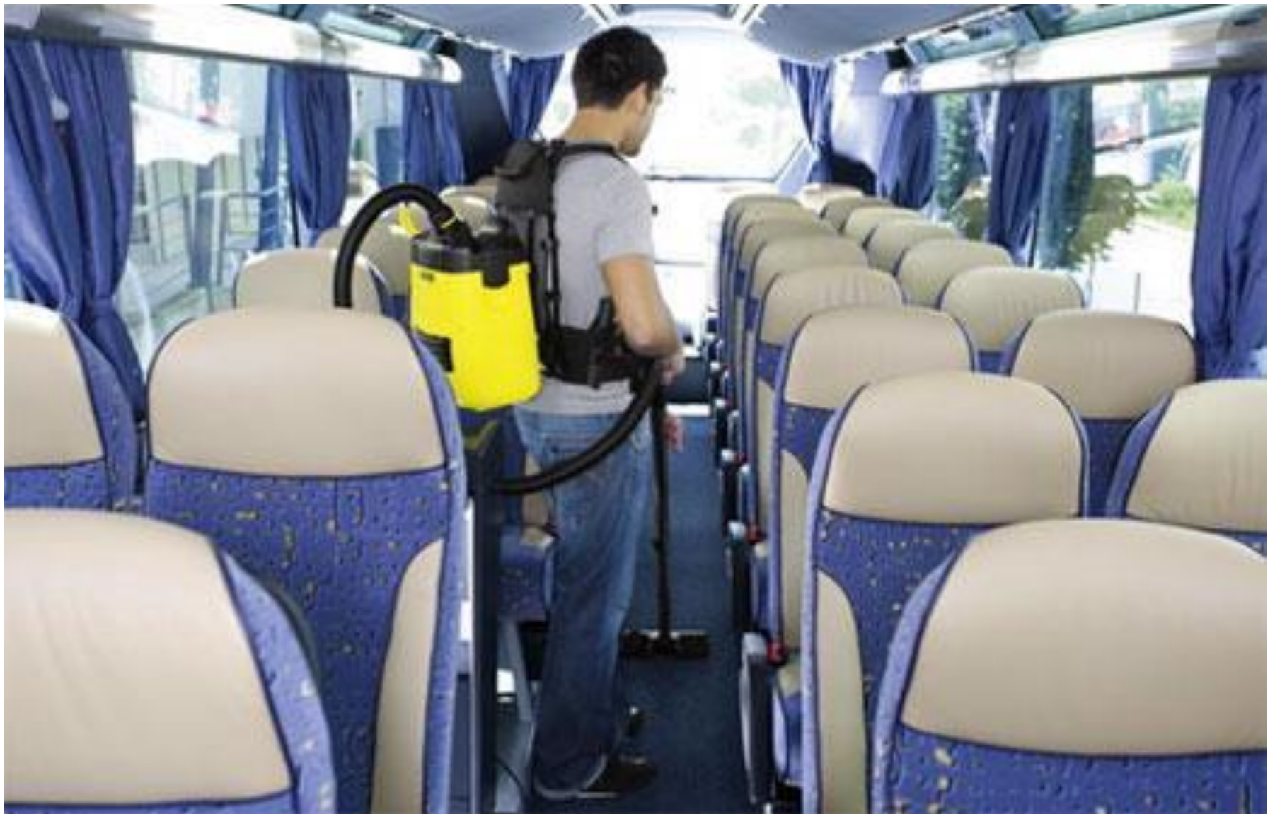
Уборка салона автобуса пылесосом