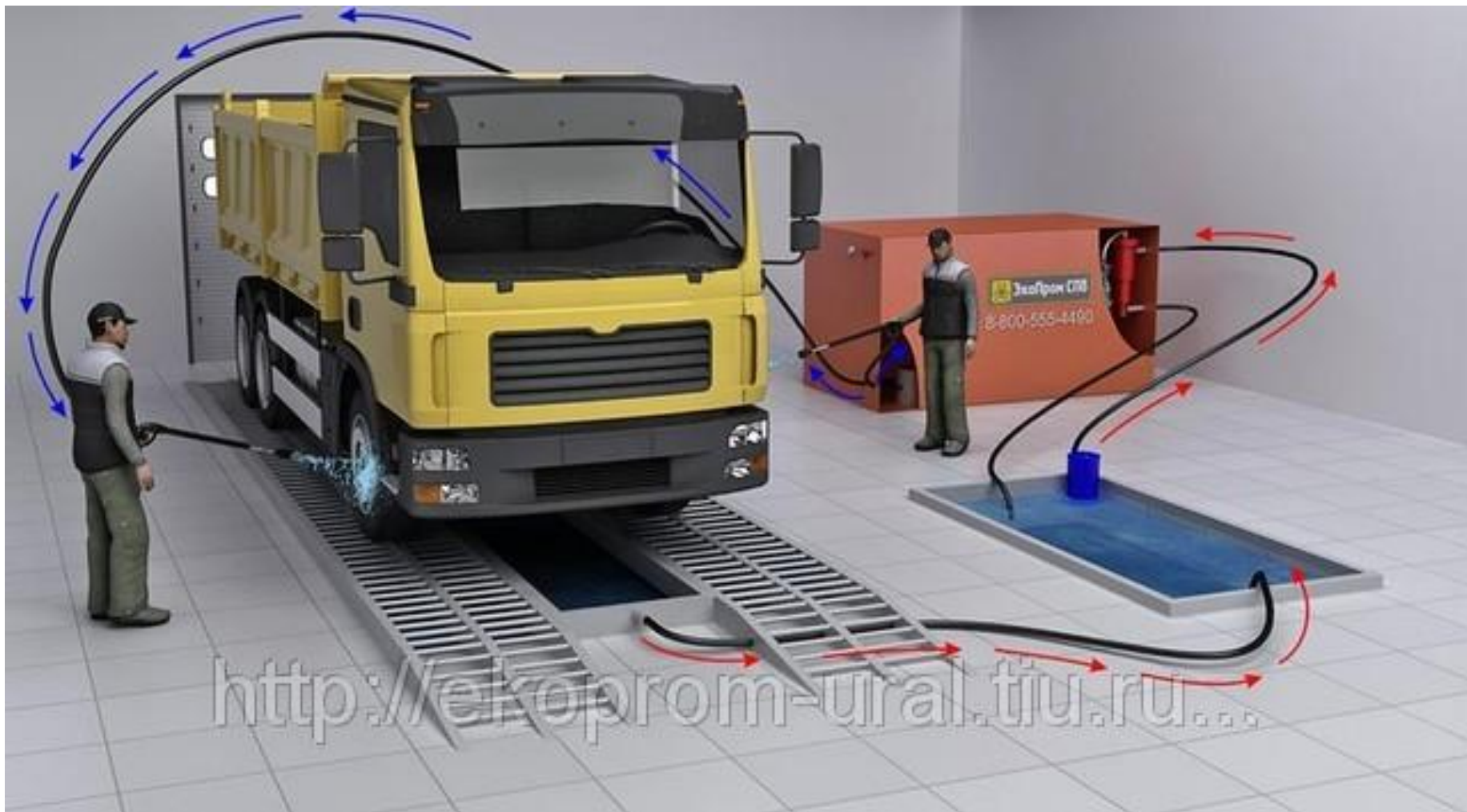
Канавка для мойки автомобилей с очисткой использованной воды