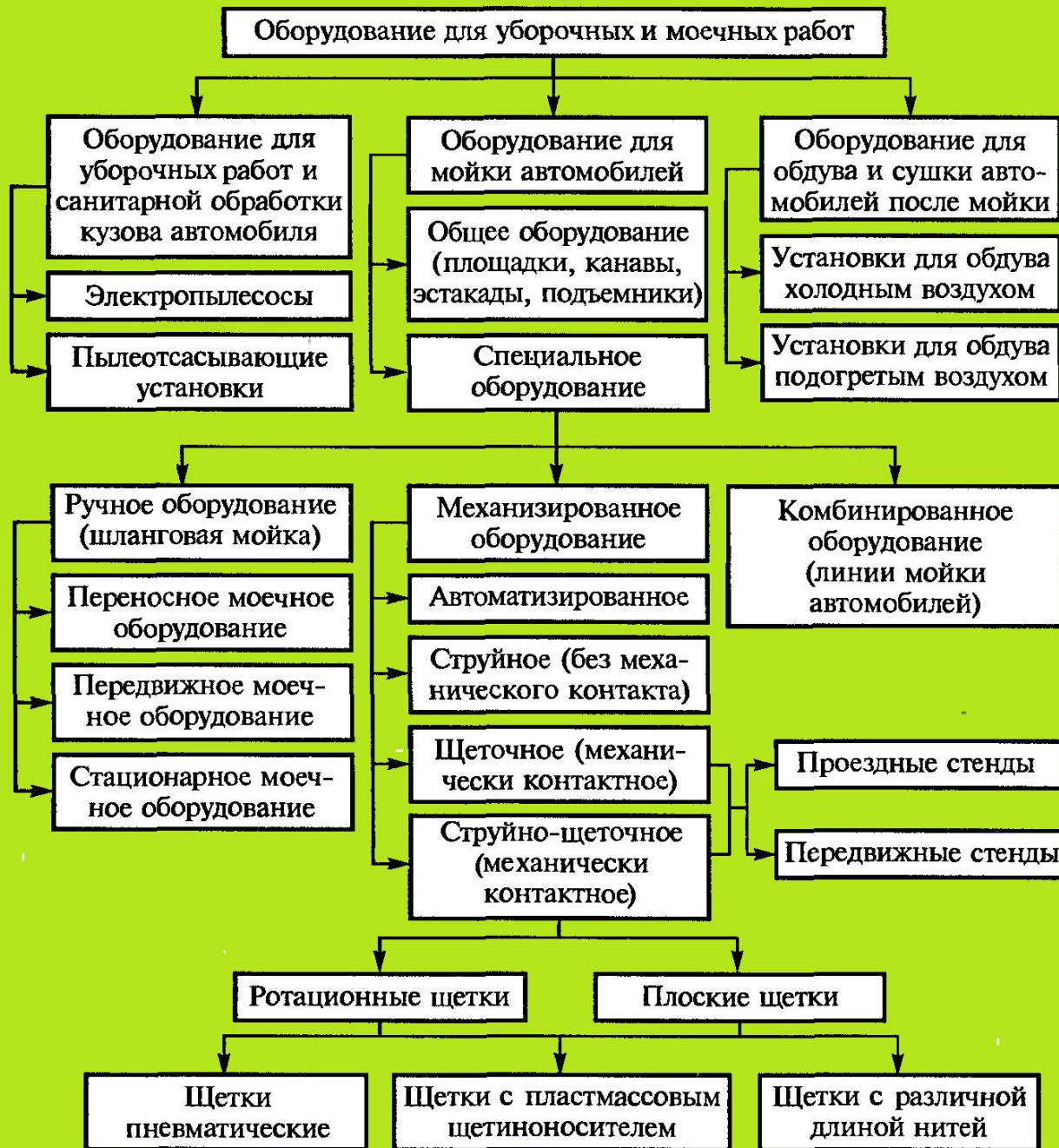
Рис. 5.1. Классификация уборочно-моечного оборудования