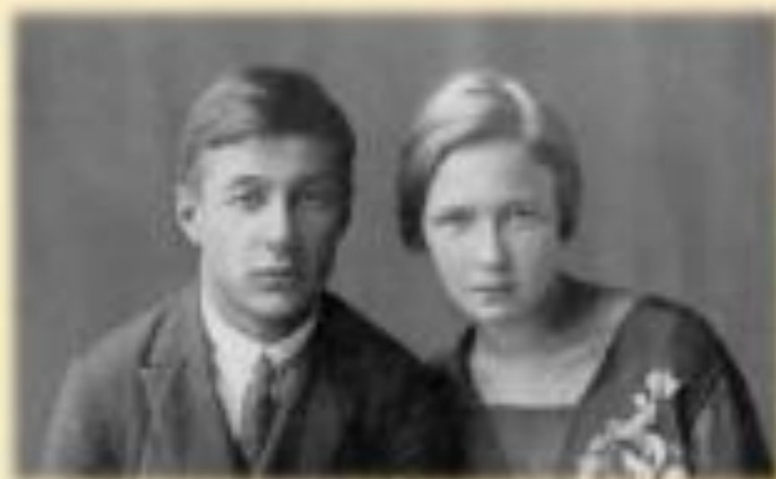
Ольга Берггольц и Борис Корнилов