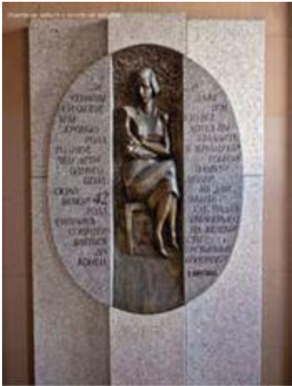
Памятная доска на Доме Радио в г. Ленинграде - Санкт-Петербурге