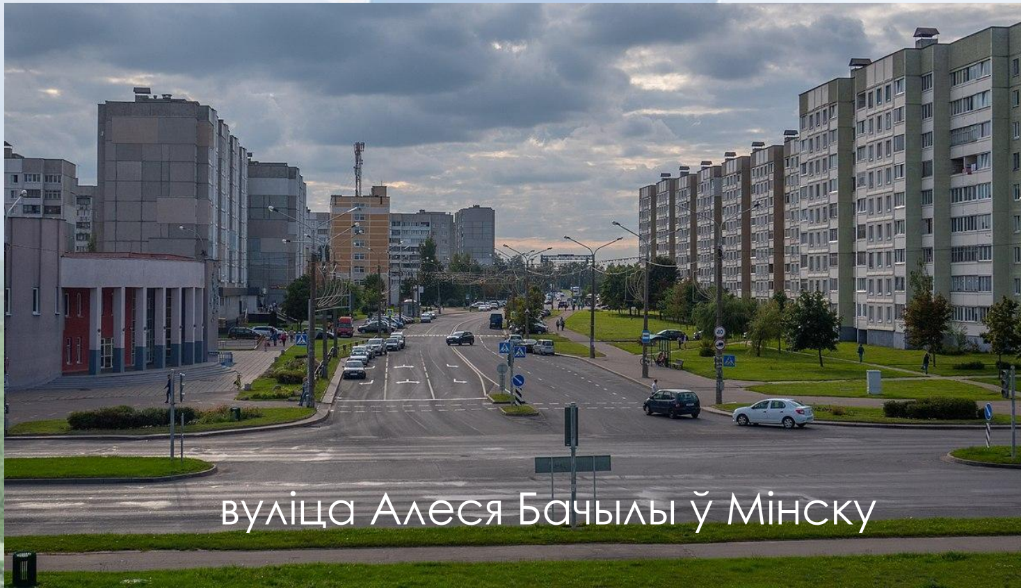
вуліца Алеся Бачылы ў Мінску

Яго імя носяць вуліцы у г.Мінску, г.Мар'інай Горцы і аг. Міханавічы