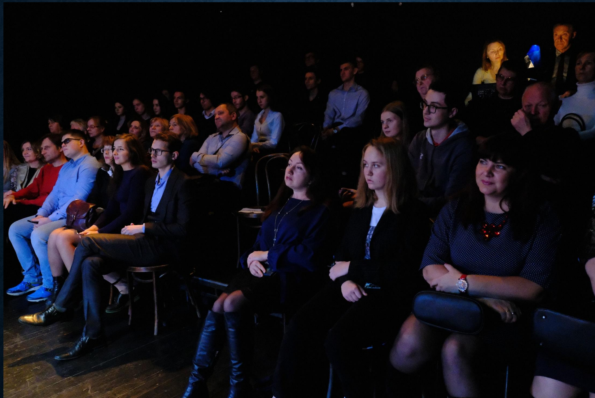
«Чацкий. Возвращение в Москву», Санкт-Петербург, 27 октября 2019г.