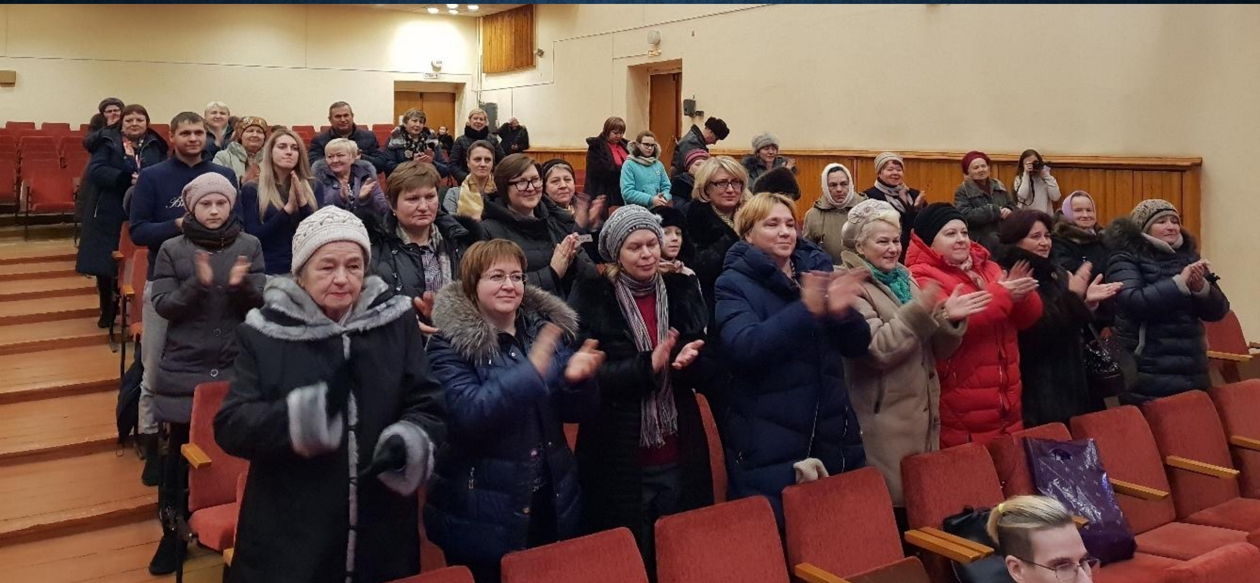
«Женитьба Фигаро», Ельня, 21 декабря 2018г.