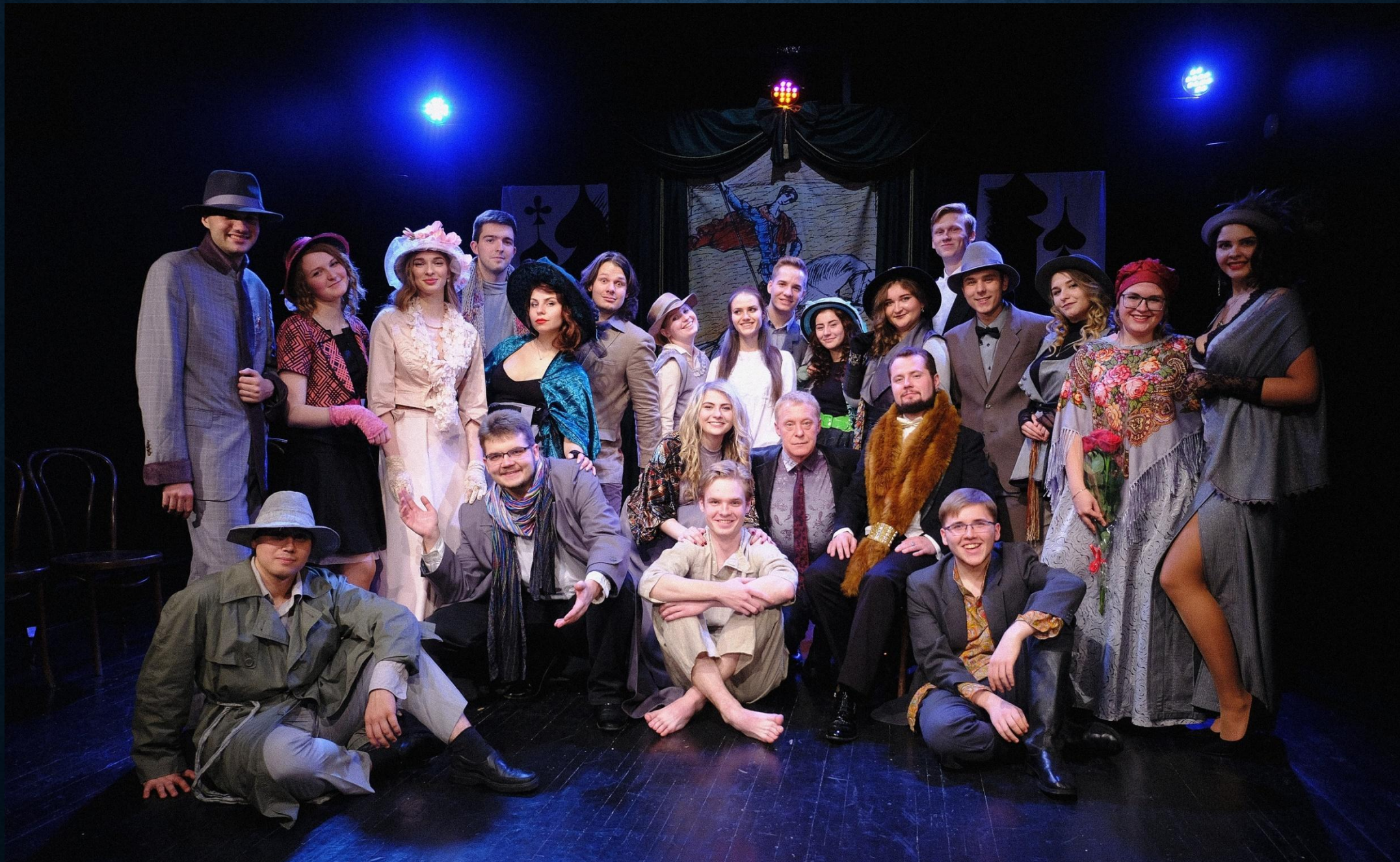
«Чацкий. Возвращение в Москву», Санкт-Петербург, 27 октября 2019г.