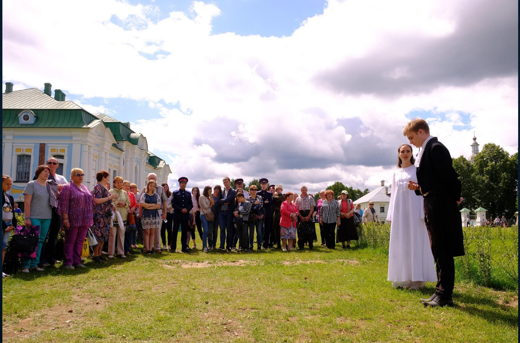
«Чацкий. Возвращение в Москву», Хмелита, 24 августа 2019г.