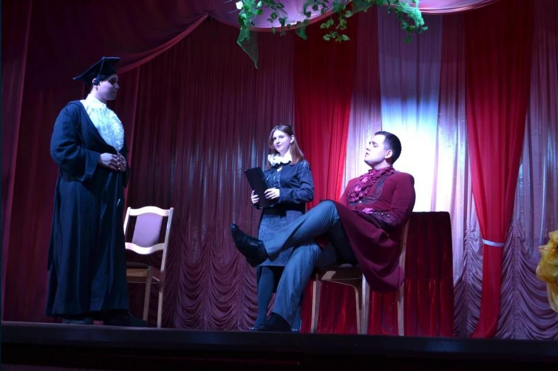
«Женитьба Фигаро», Починок, 8 декабря 2018г.