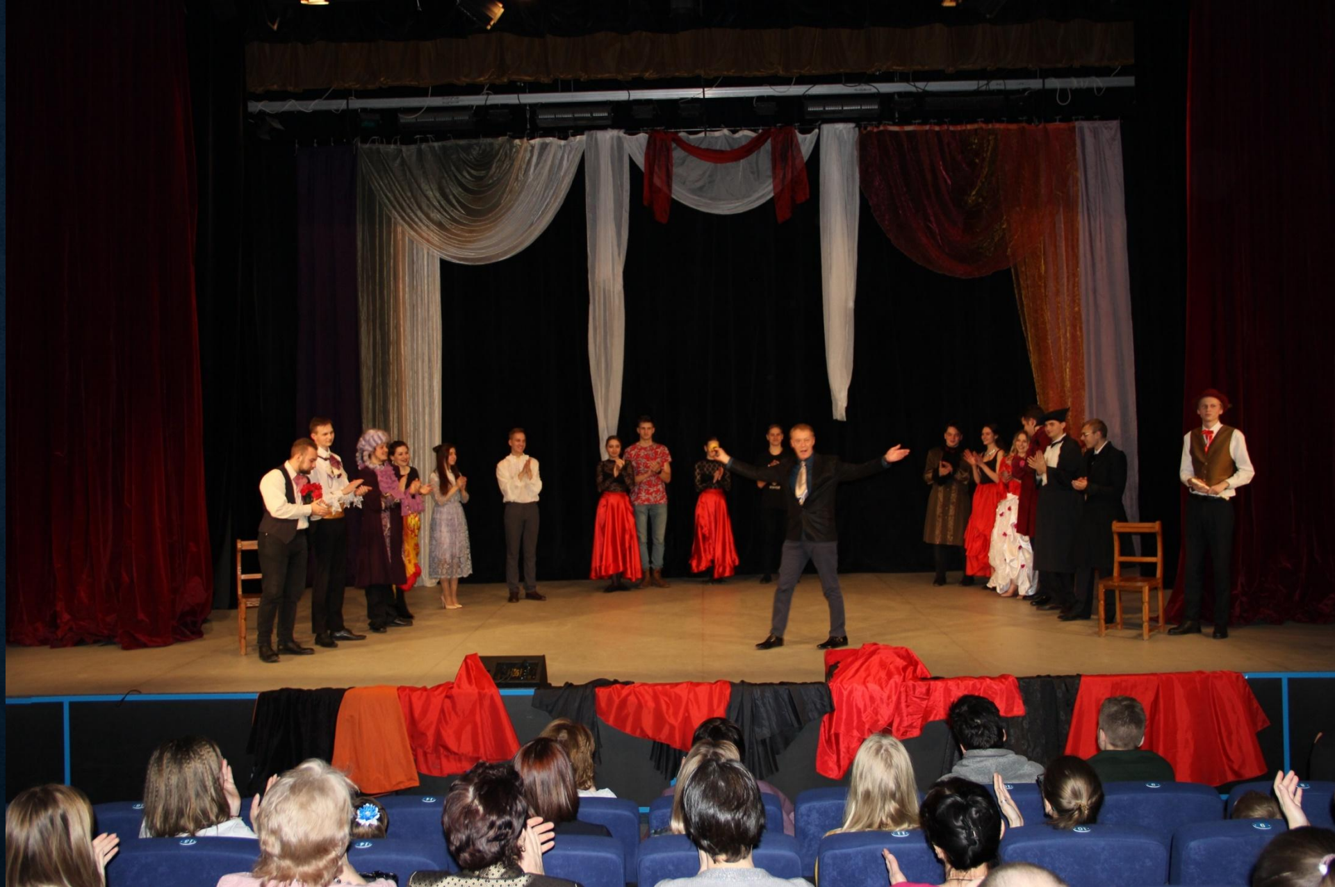
«Двенадцатая ночь», Десногорск, 22 февраля 2020г.