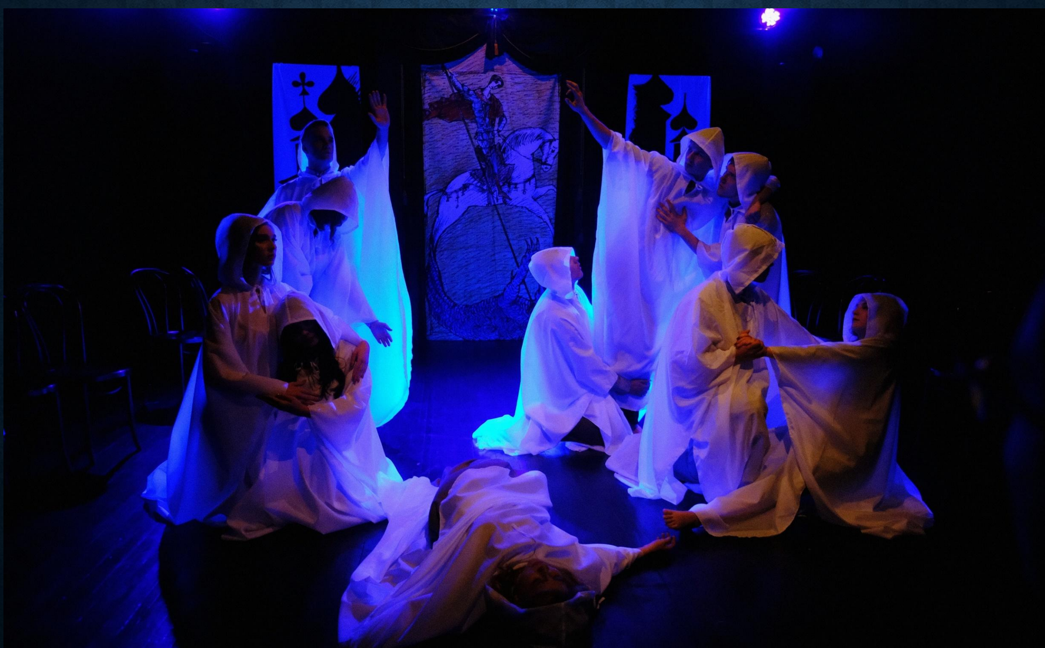
«Чацкий. Возвращение в Москву», Санкт-Петербург, 27 октября 2019г.