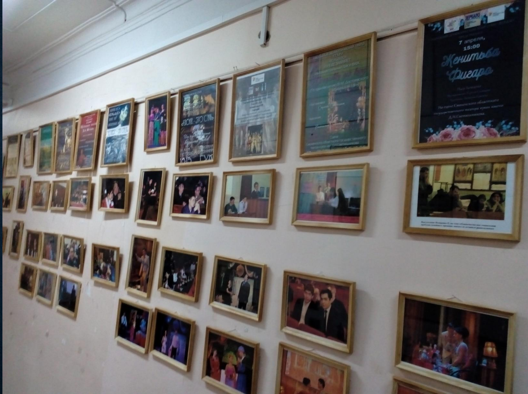
Путь длиною 15 лет. Юбилейная фотовыставка на кафедре философии