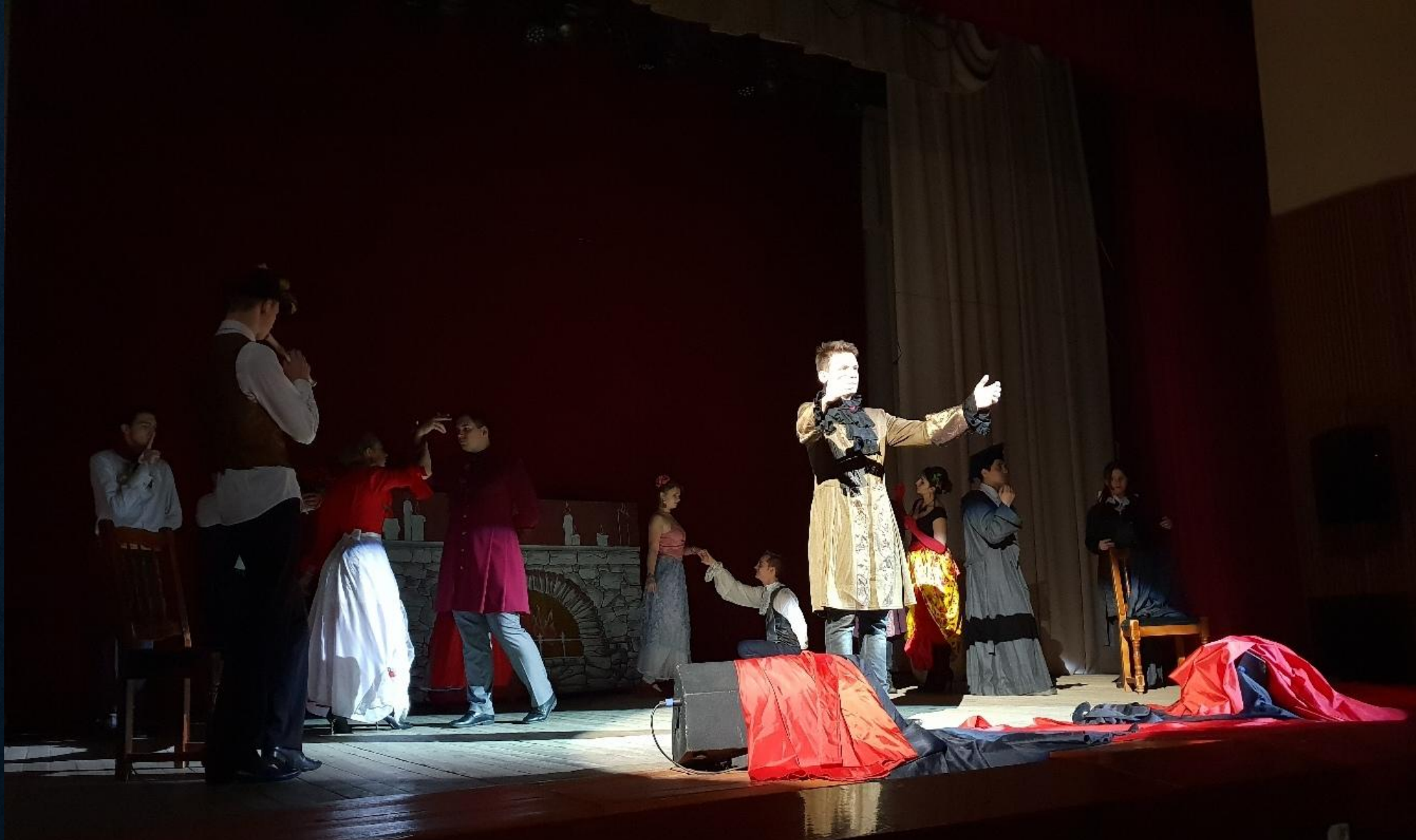
«Женитьба Фигаро», Ельня, 21 декабря 2018г.