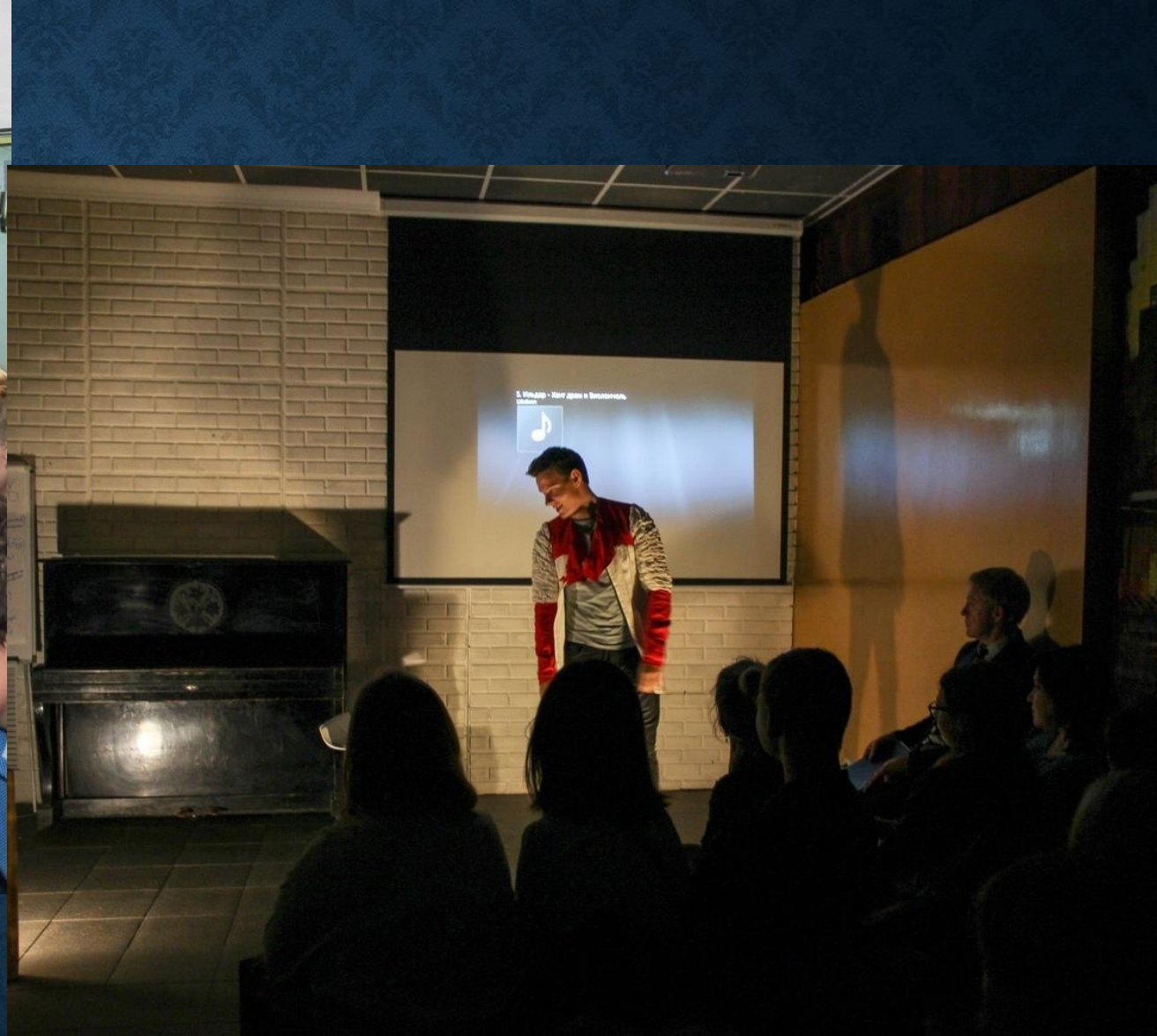
Творческий вечер НДТ СГМУ "Зеркало" в ШТАБЕ 21 сентября 2018г.