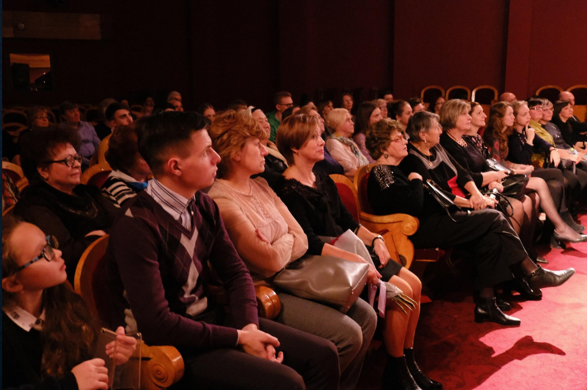
«Чацкий. Возвращение в Москву», Москва, 26 октября 2019г.