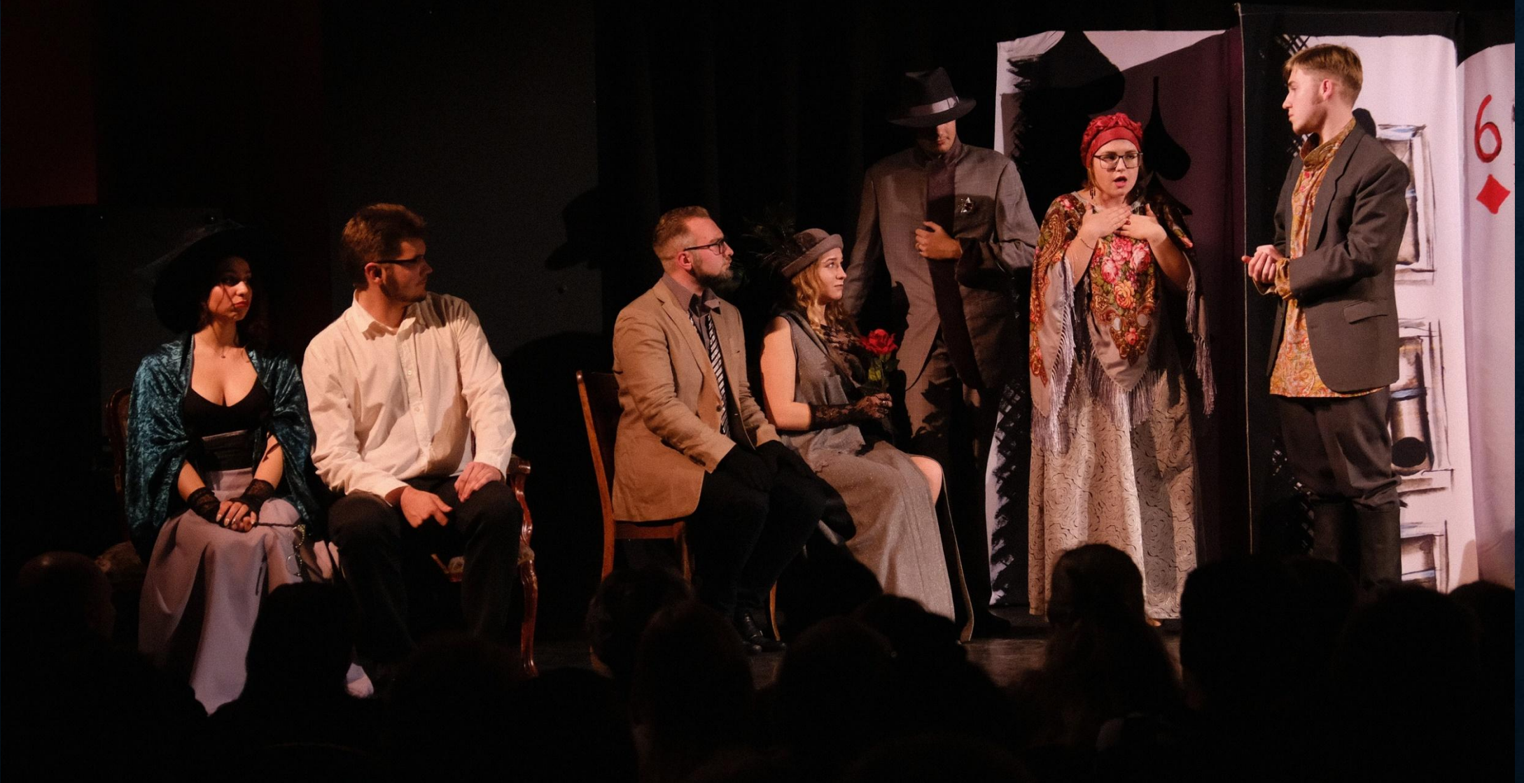
«Чацкий. Возвращение в Москву», Москва, 26 октября 2019г.