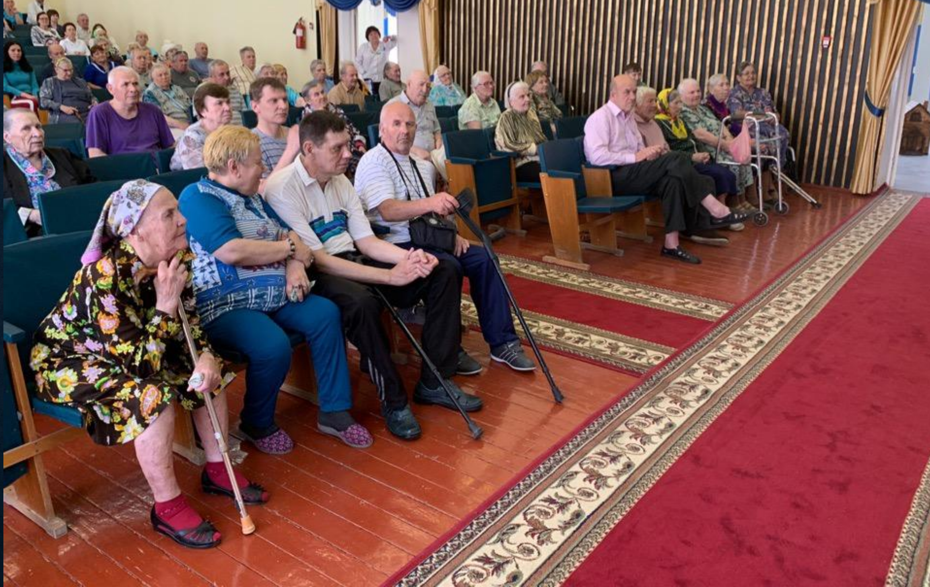
«Чацкий. Возвращение в Москву», Геронтологический центр "ВИШЕНКИ", Смоленск, 6 июня 2019г.