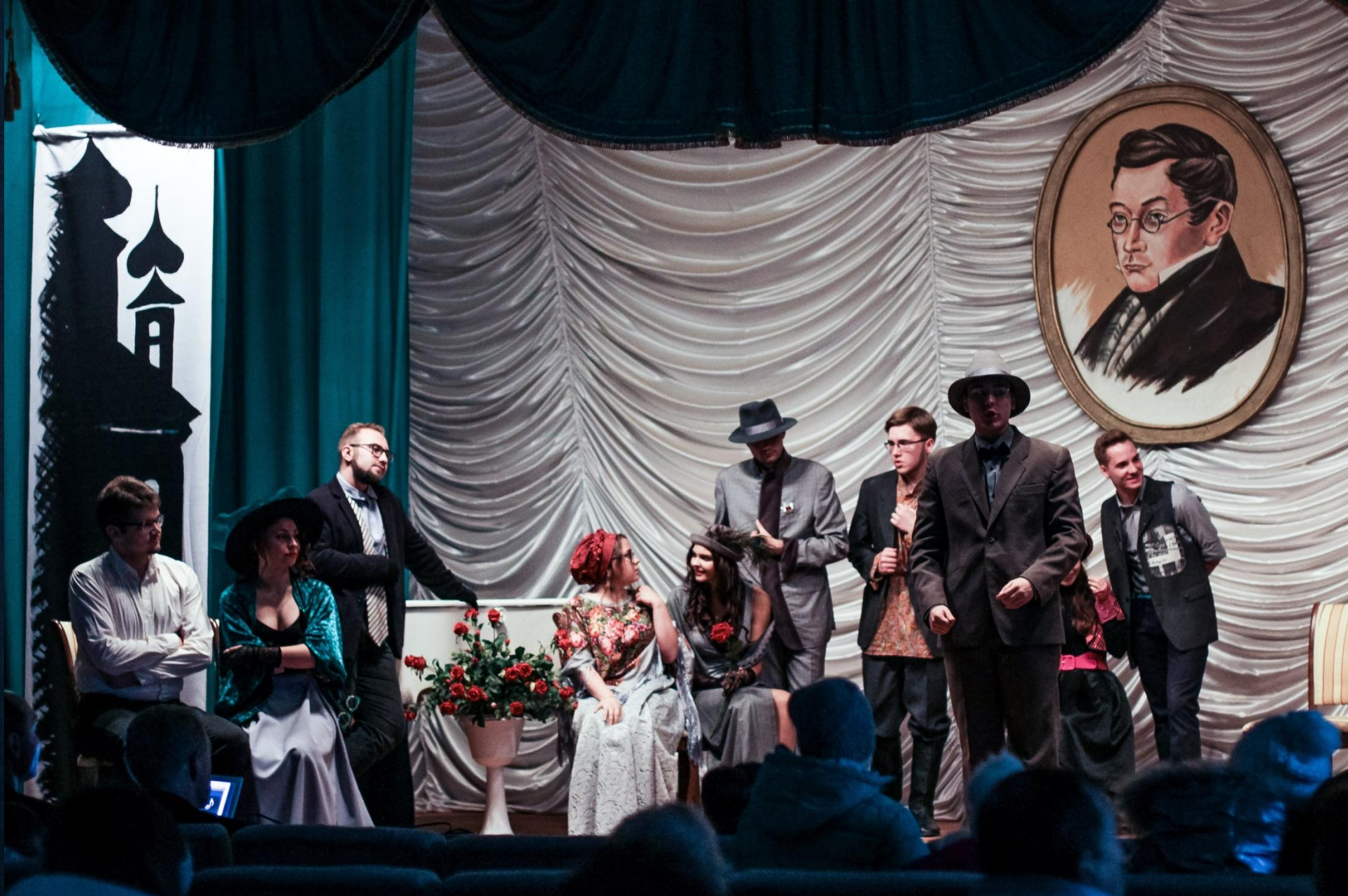
«Чацкий. Возвращение в Москву», Хмелита, 3 ноября 2019г.