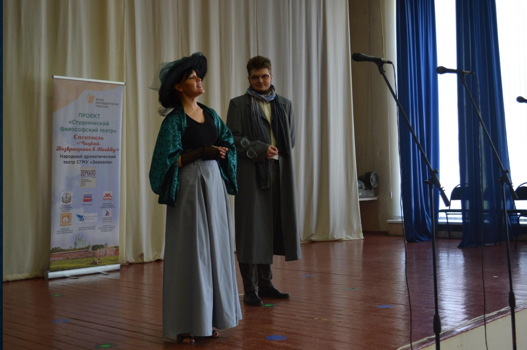
«Чацкий. Возвращение в Москву», Геронтологический центр "ВИШЕНКИ", Смоленск, 6 июня 2019г.