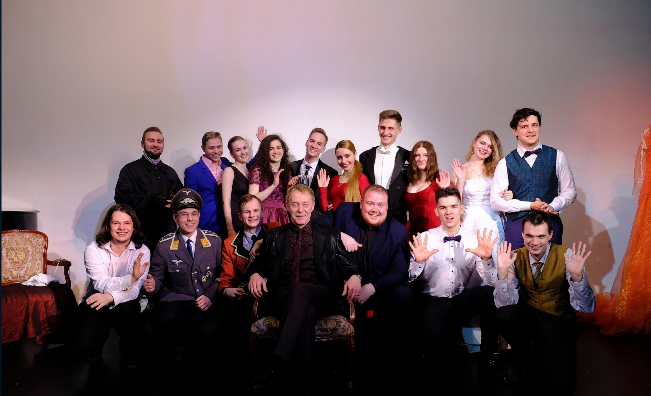
ЦДРИ, Москва. Спектакль «Двенадцатая ночь», 28 февраля 2020г.