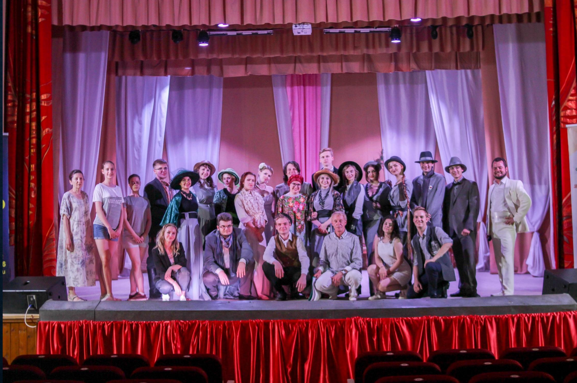
«Чацкий. Возвращение в Москву», Красный, 7 июня 2019г.