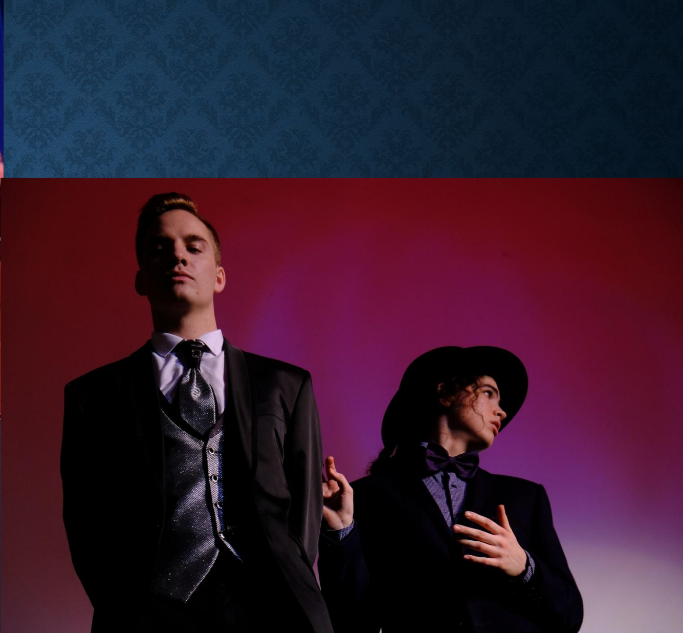
ЦДРИ, Москва. Спектакль «Двенадцатая ночь», 28 февраля 2020г.