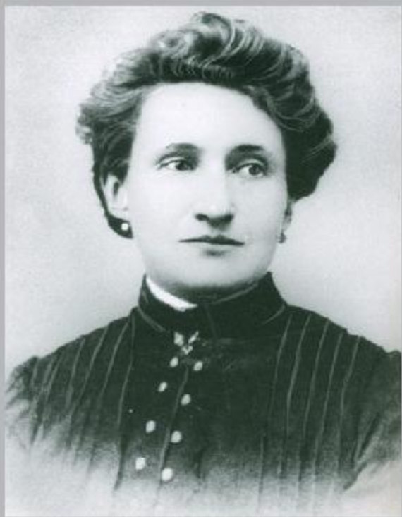
Мария Александровна Цветаева, урожденная - Мейн. 1903 г.

Так получилось, что Марина с мамой часто жила за границей, поэтому свободно говорила не только по-русски, но и на французском и немецком языках. Более того, когда маленькая шестилетняя Марина Цветаева стала писать стихи, то сочиняла она на всех трех, причем больше всего – по-французски.