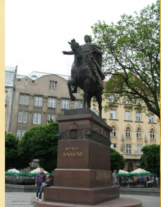
Львів 2001 рік