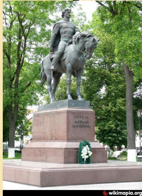
Галич 1998 рік