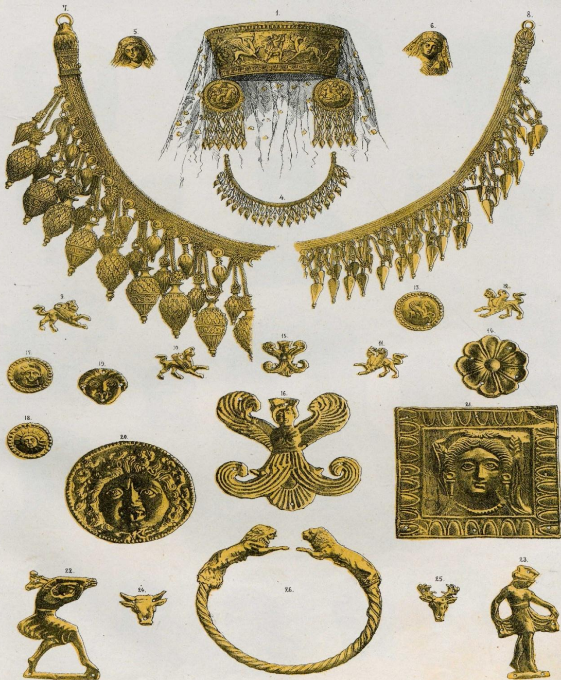
Головной убора и украшения одежды жрицы Димитри, найденные в ее гробнице.