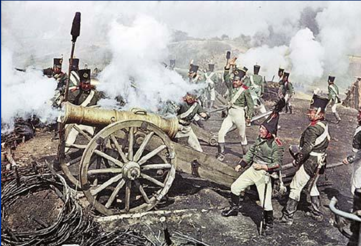
Пьер на батарее Раевского