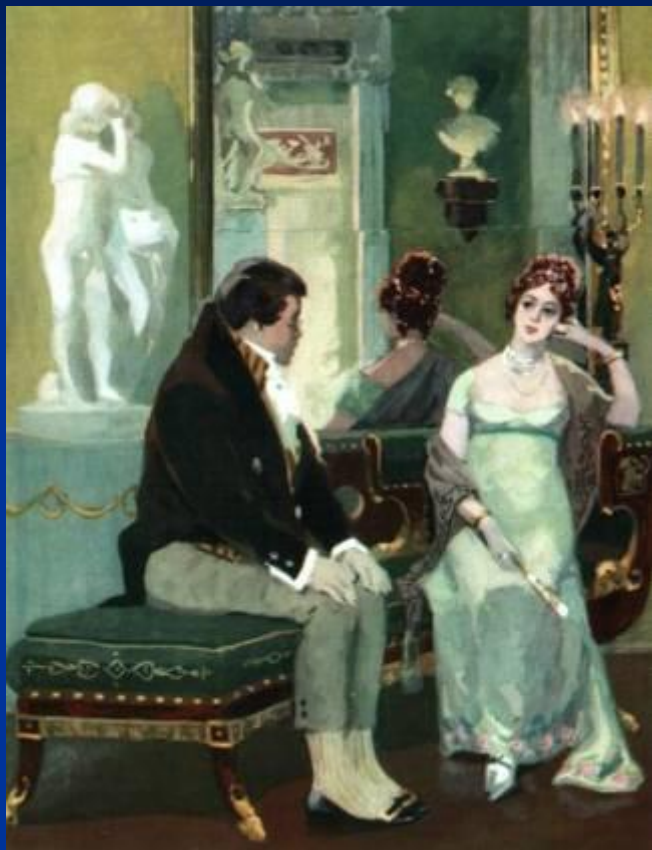
Женитьба на Элен Курагиной