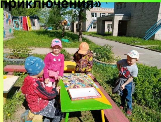
Стол и скамейки для настольных игр.