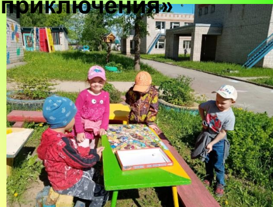
Стол и скамейки для настольных игр.