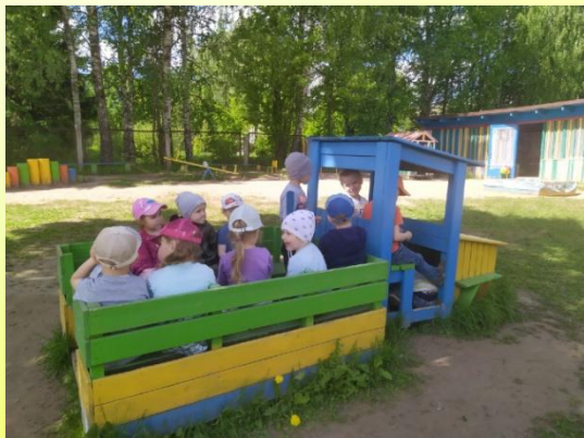
Грузовая машина для игр «Шофёр», «Путешествие»