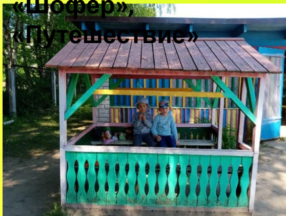
Домик для игр «Семья», «Кафе», «Магазин» и др.