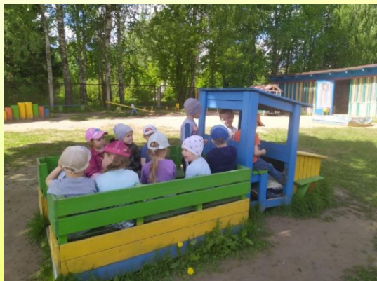
Грузовая машина для игр «Шофёр», «Путешествие»