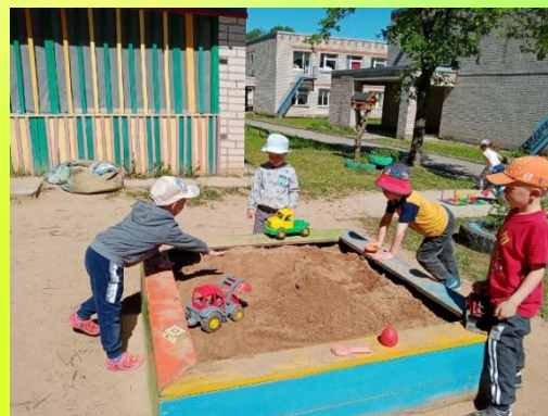
Песочница для создания замков, построек, для игр с машинками, формочками, «выпечки» куличиков, игр экспериментирования с песком и водой.