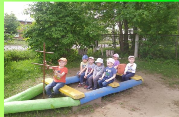
Корабль для игр «Капитан», «Морские приключения»