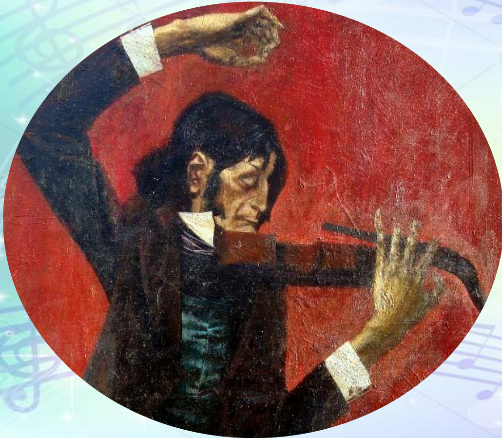
П. Васюков. «Никколо Паганини»