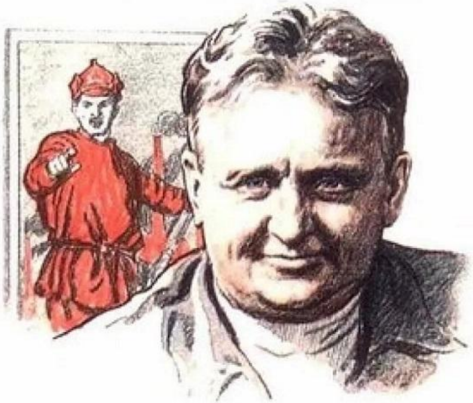
Заслуженный деятель искусств РСФСР художник Д. С. МООР 1883—1946

Дмитрий Моор (Орлов) Работал в жанре карикатуры и политического плаката