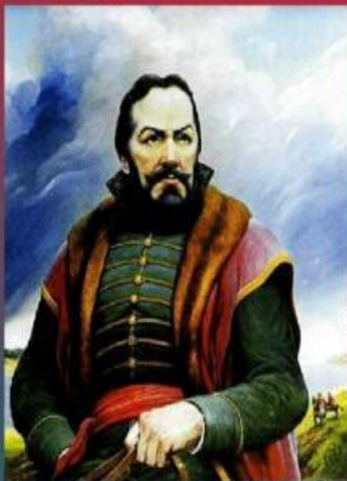
Воевода Богдан Матвеевич Хитрово