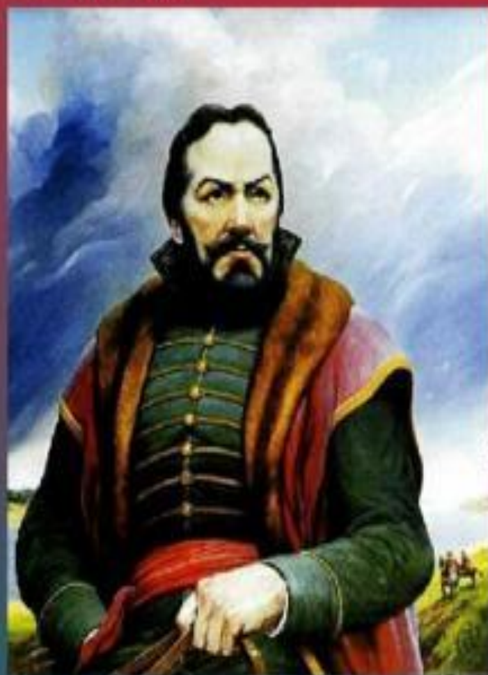
Воевода Богдан Матвеевич Хитрово