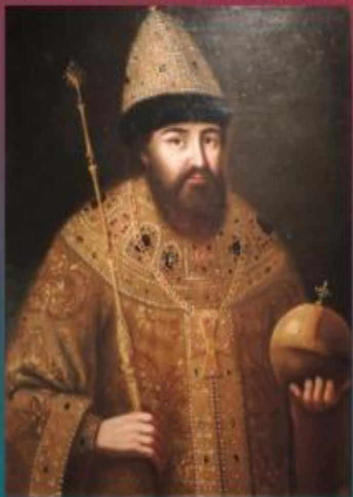
Царь Алексей Михайлович

□ Ульяновск был основан в 1648 году по указу царя Алексея Михайловича воеводой Богданом Матвеевичем Хитрово к крепость Синбирск (позже – Симбирск).