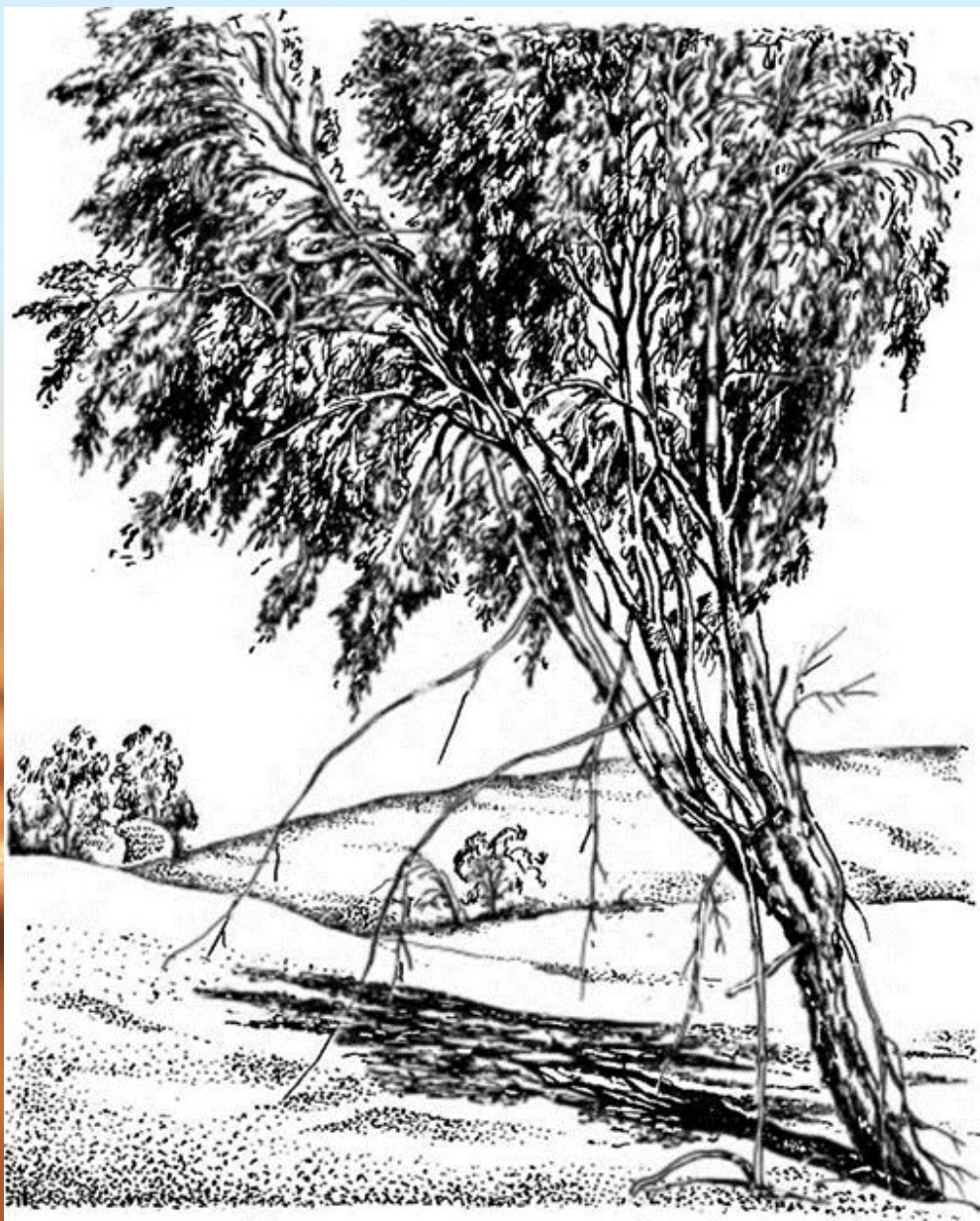
Рис. 2. Засохшие придаточные корни, сохранившиеся в кроне песчаной акации после отступления бархана