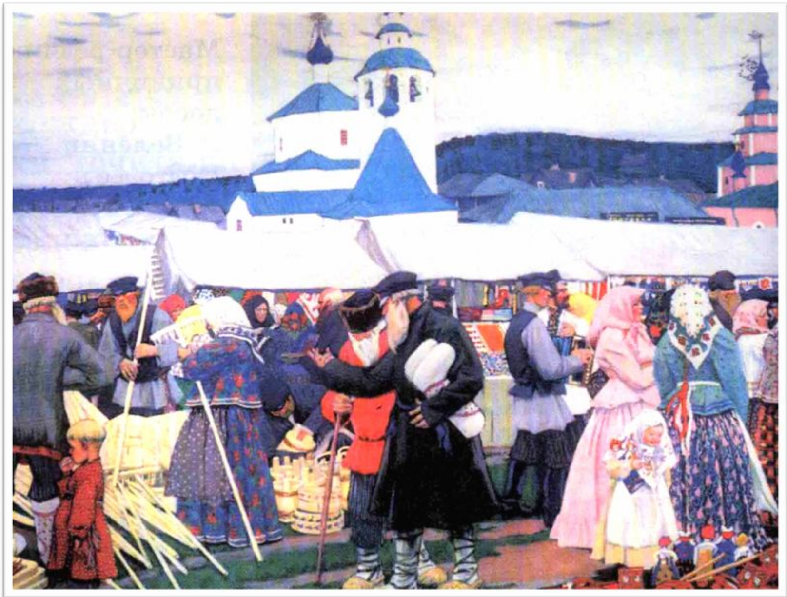
Б. Кустодиев. Ярмарка.