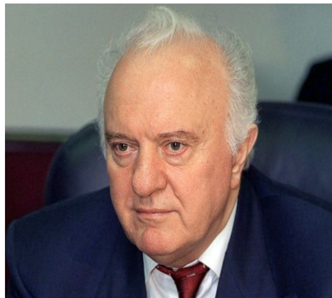
Шеварднадзе Эдуард Амвросиевич ▶