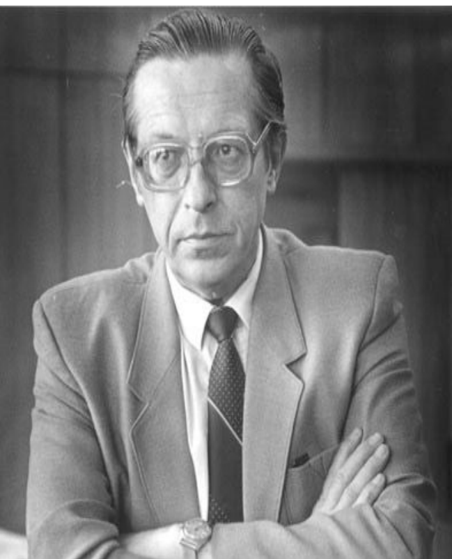
Леонид Иванович Абалкин

Экономические программы перехода к рынку