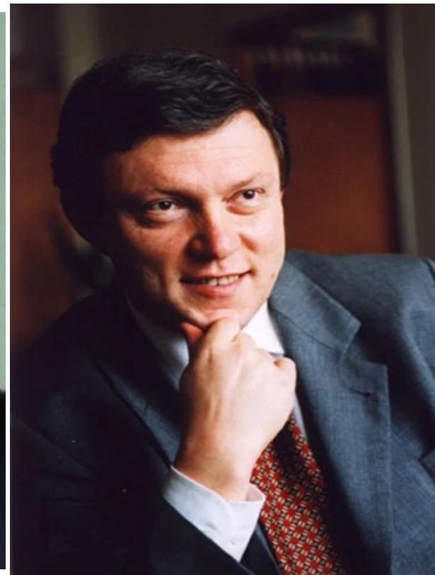
Григорий Алексеевич Явлинский