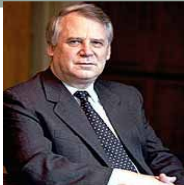
▲ Рыжков Николай Иванович