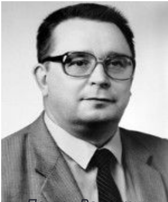
Павлов Валентин Сергеевич

Программа В. С. Павлова начала осуществляться с января 1991 года. Согласно реформе, в течение трех дней проводился обмен 50- и 100-рублевых купюр образца 1961 года. На 1 человека можно было обменять не более 1000 рублей, возможность обмена других купюр рассматривалась в специальных комиссиях до конца марта 1991 года.