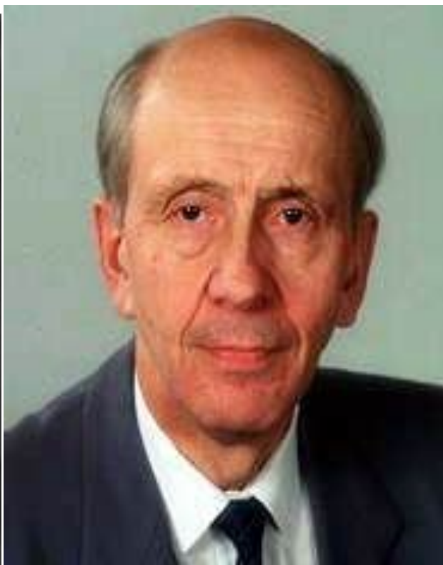
Станислав Сергеевич Шаталин