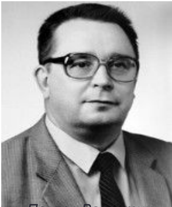
Павлов Валентин Сергеевич

Программа В. С. Павлова начала осуществляться с января 1991 года. Согласно реформе, в течение трех дней проводился обмен 50- и 100-рублевых купюр образца 1961 года. На 1 человека можно было обменять не более 1000 рублей, возможность обмена других купюр рассматривалась в специальных комиссиях до конца марта 1991 года.